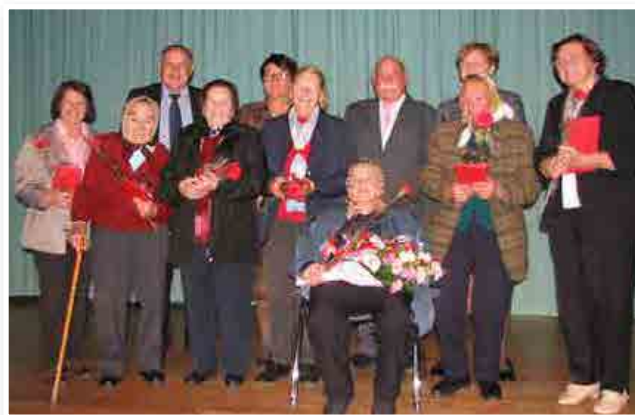
Gospo v ospredju z najstarejšo še živečo cerkvjenjaško krvodajalko so kri darovale že pred 60 leti.