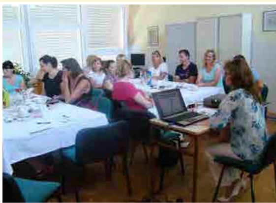
Srečanje z organizatorji prehrane v vrtcih v Mariboru

letu je aktivno k pripravi projektne predloga »Samooskrba regije« pristopilo Območno razvojno partnerstvo Slovenske gorice – ORP SG (občine Benedikt, Cerkvenjak, Duplek, Lenart, Pesnica, Sveta Ana, Sv. Trojica v Slov.