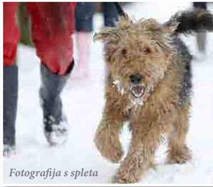
Fotografija s spleta

naloga vsakega lastnika oz. skrbnika psa. Še posebej pozorni bodite na to, da si vaš pes