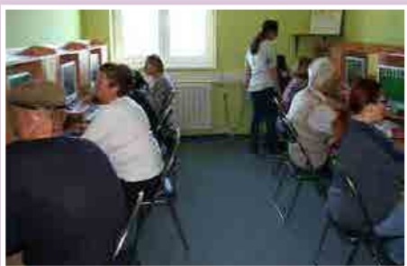
Začetno učenje računalništva