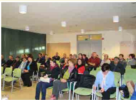
Srečanje s pridelovalci 4. novembra v Lenartu

Sejem bo popestril bogat spremljevalni program. Vljudno vabljeni na trg!