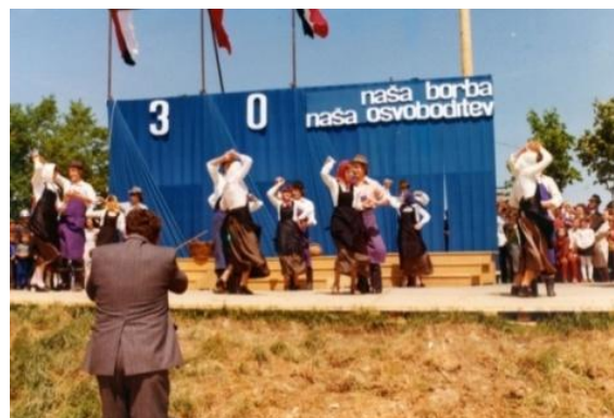
Slika 7: Osrednja občinska proslava ob 30-letnici osvoboditve. (Sveta Trojica, 1975.)