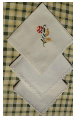
Slika 29: Pražnji robčki.