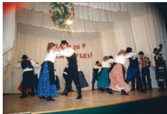
Slika 20: Srečanje FS občine Lenart. (Jurovski Dol, 22. marec 1996.)