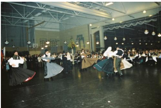
Slika 38: Folklorni festival. (Hartberg, 21. februar 2004.)