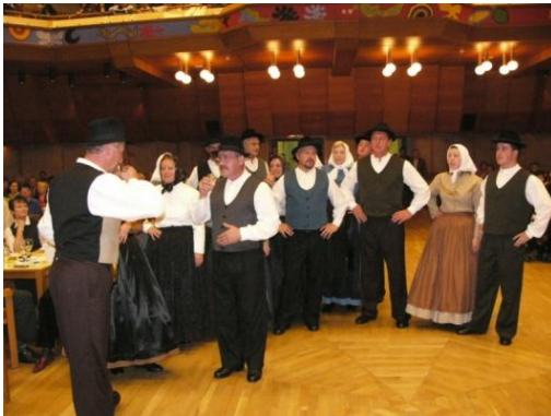
Slika 36: GODOVNO. (Eisenstadt, 26. oktober 2004.)