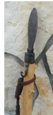
Slika 79: Konica ovtarske palice.