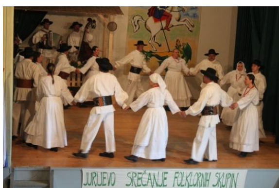
Slika 95: FS Šmarječani iz Pernice.