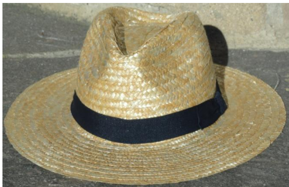
Slika 80: Slamnati klobuk.

Ženske so takrat nosile drukane kikle na pas z drobnimi belimi rožicami (drukan fürtoh), spodnje belo in rdeče ali sivo itn., progasto spodnje krilo. Pokrite so bile z bombažnimi rutami.