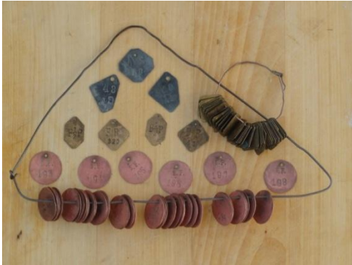
Slika 51: Poletne (kovinske ploščice z oznakami lastnikov).

Svoj največji uspeh smo dosegli leta 2005, ko smo bili z odrsko postavitvijo POLETNE izbrani za nastop na II. delu državnega srečanja odraslih folklornih skupin, ki je potekalo v Beltincih.