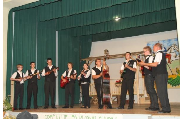
Slika 110: Tamburaška skupina KUD KLARUŠ Maruševac, Hrvaška.