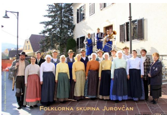
Slika 83: Martinovanje (Jurovski Dol, 11. november 2012.)