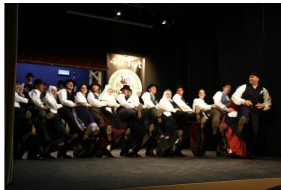
Slika 115: FS Lancova vas.