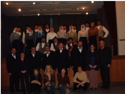
Slika 44: Obisk in nastop pri slovenski katoliški misiji. (Berlin, 4. november 2006.)