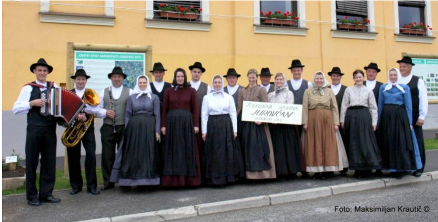
Slika 25: Jurovski Dol, 18. april 2010.

Ženske krasijo zelo lepo ohranjene židane rute ali tudi židanice in peče. Folklorni skupini so jih poklonile številne Jurovčanke.