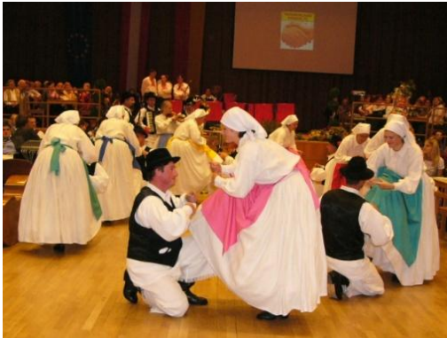
Slika 34: FSAKA PTICA JE VESELA med plesom prekmurskih plesov. (Eisenstadt, 26. oktober 2004.)