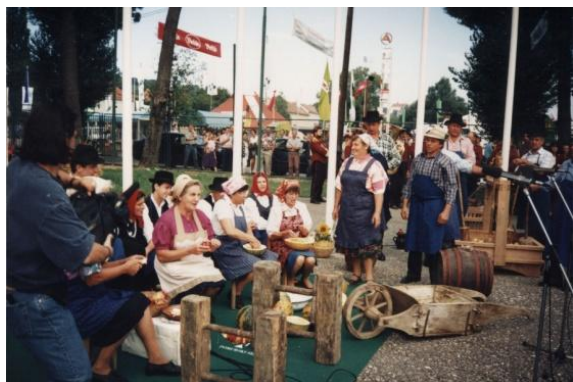
Slika 19: Otvoritev kmetijsko živilskega sejma v Gornji Radgoni z virtom Nacekom in gospodinja Zefiko.