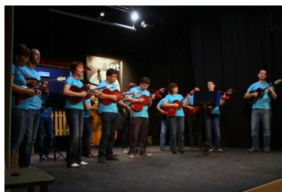
Slika 117: Tamburaški orkester Trniče.