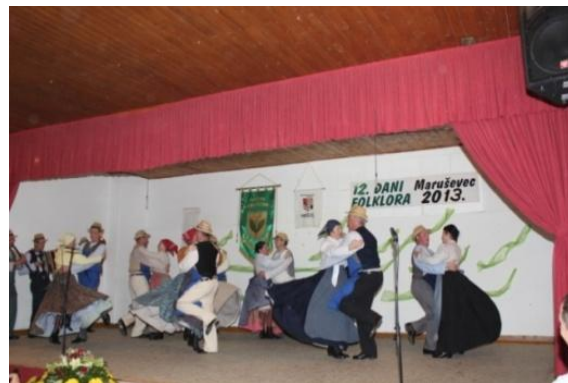
Slika 124: 12. dani folklor Maruševec 2013. (Hrvaška - Maruševec, 26. april 2013.)