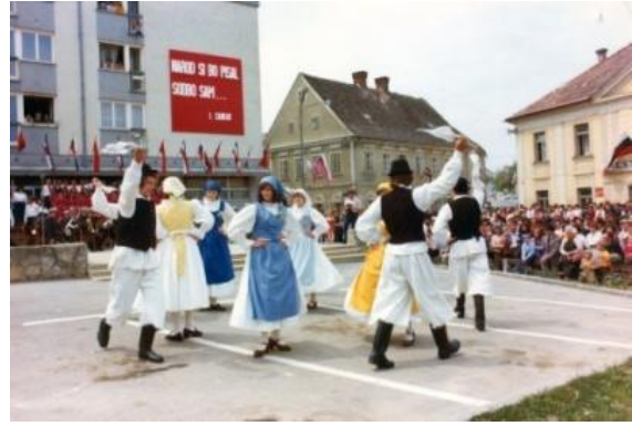
Slika 12: Otvoritev spomenika NOB. (Lenart, 1976.)