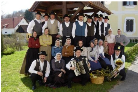
Slika 23: Jurovski Dol, 20. april 2003.

Projekt je sofinancirala Občina Lenart in ZKD Lenart, del sredstev pa smo zbrali predvsem od domačih donatorjev.