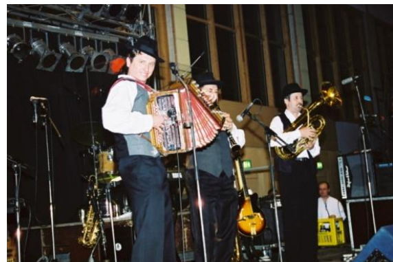
Slika 39: Folklorni festival. (Hartberg, 21. februar 2004.)