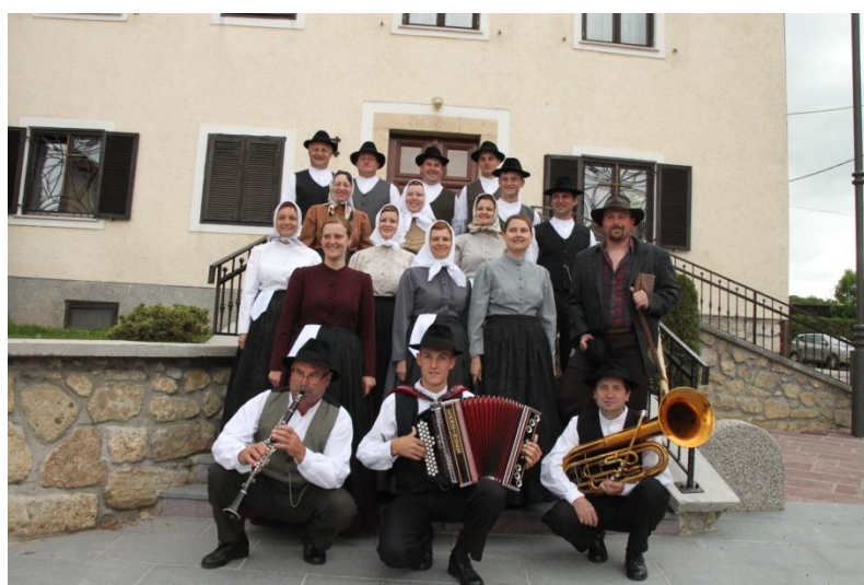
Slika 133: Folklorniki FS Jurovčan. (12. maj 2012.)