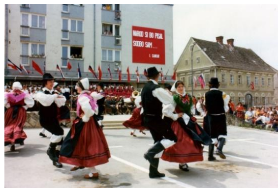
Slika 10: Otvoritev spomenika NOB. (Lenart, 1976.)