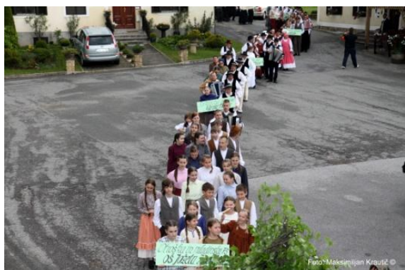
Slika 98: Povorka ob prihodu do kulturnega doma.