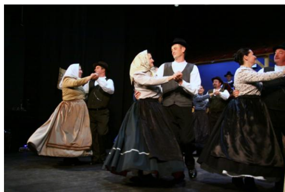
Slika 120: FS Jurovčan.