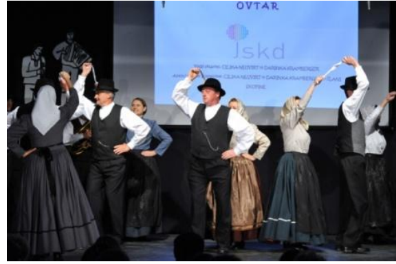
Slika 75: OVTAR – regijsko srečanje odraslih FS. (Podgorci, 3. junij 2012.)