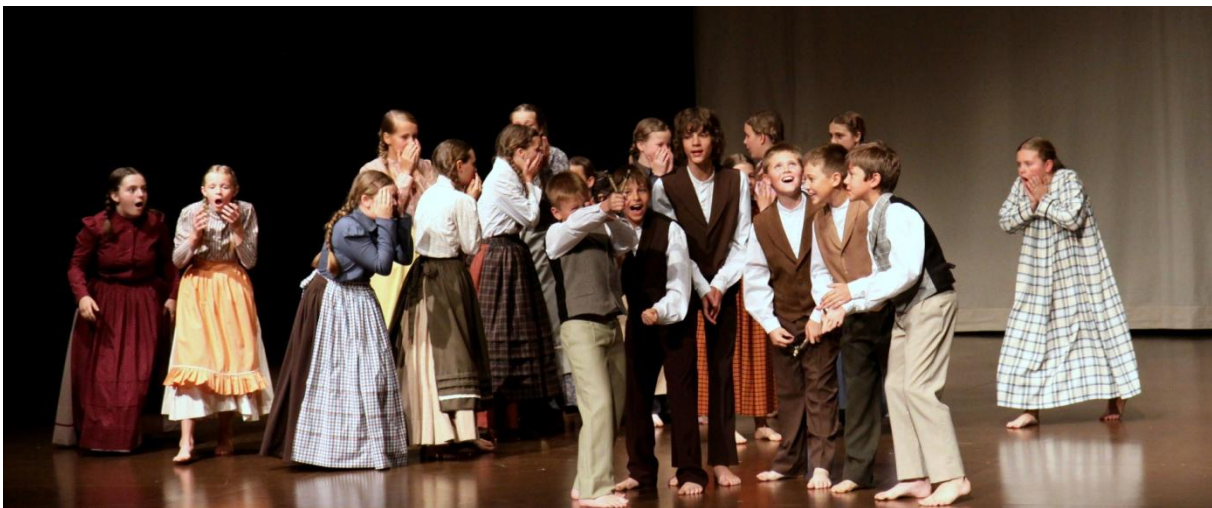
Slika 128: Otroška FS Šleka pac. (RINGARAJA, 2012.)