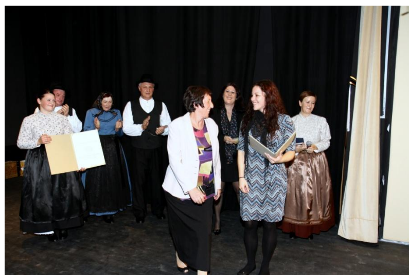
Slika 137: 40-letnica FS Jurovčan, podeljevanje priznanj.