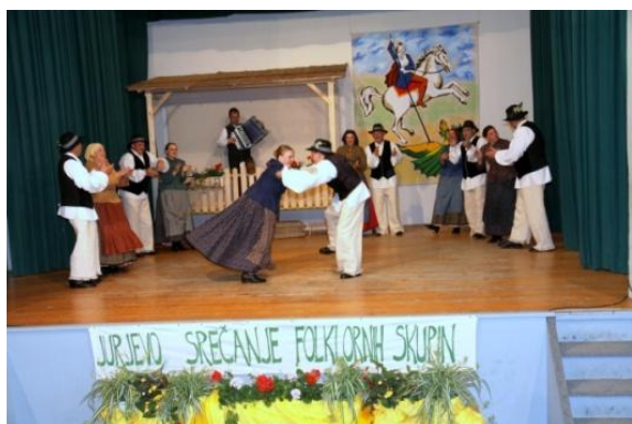
Slika 100: FS Marija Snežna, EKD Snežna iz Zgornje Velke.