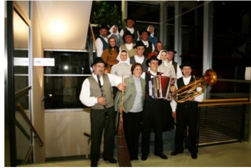
Slika 47: Slowenischer Kulturabend. (Neuhofen an der Ybbs v Spodnji Avstriji, 19. april 2008.)