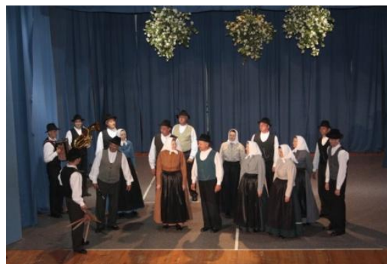
Slika 63: Regijsko srečanje odraslih FS. (Lenart, 22. maj 2009.)