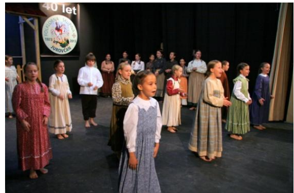
Slika 113: Otroški FS Knofeki in Šleka pac iz OŠ Jožeta Hudalesa.