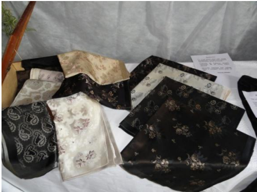
Slika 26: Židane rute ali tudi židanice v dobro ohranjeni leseni škatli iz tistega časa.

Ženske krasijo zelo lepo ohranjene židane rute ali tudi židanice in peče. Folklorni skupini so jih poklonile številne Jurovčanke.