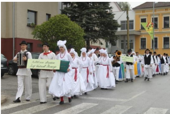
Slika 91: Povorka FS od OŠ Jožeta Hudalesa do kulturnega doma.