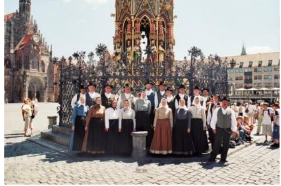
Slika 41: Skupinska fotografija pri vodnjaku Schöner Brunnen. (Nürnberg, 16. julij 2006.)