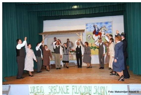
Slika 101: FS Kulturnega društva Jakob Sket Mestinje.