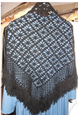
Slika 28: Štrekanca.