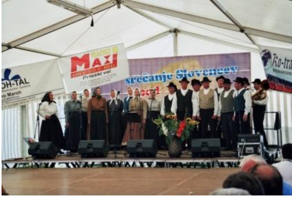
Slika 40: Srečanje Slovencev Pod brajdami pri Nürnbergu. (15. julij 2006.)