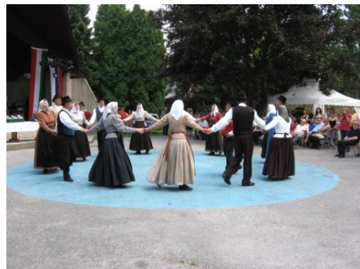
Slika 43: Srečanje treh dežel Avstrije, Italije in Slovenije. (Baernbach, 17. junij 2006.)