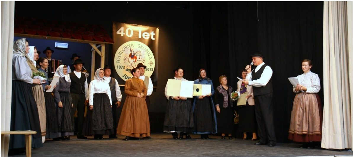
Slika 135: 40-letnica FS Jurovčan, podeljevanje priznanj.