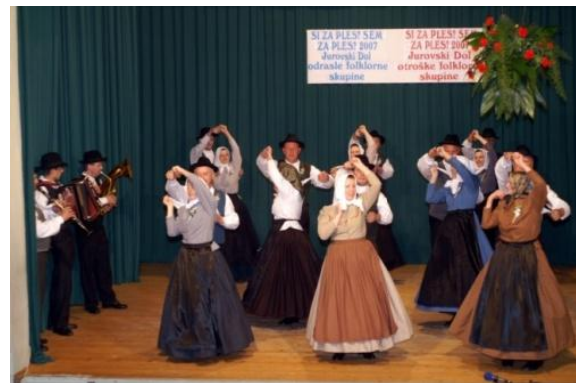
Slika 59: Območno srečanje odraslih FS. (Jurovski Dol, 20. april 2007.)