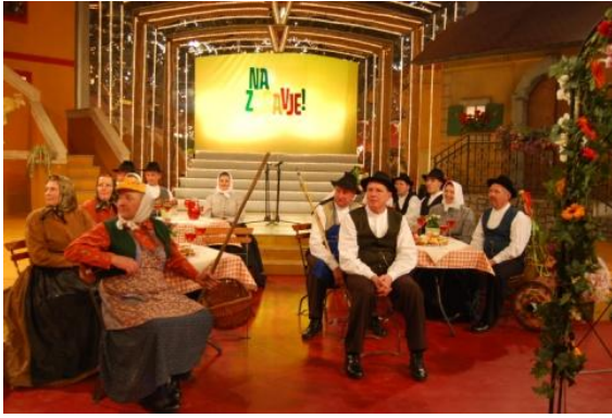
Slika 89: RTV Slovenija NA ZDRAVJE. (Ljubljana, 10. februar 2009.)