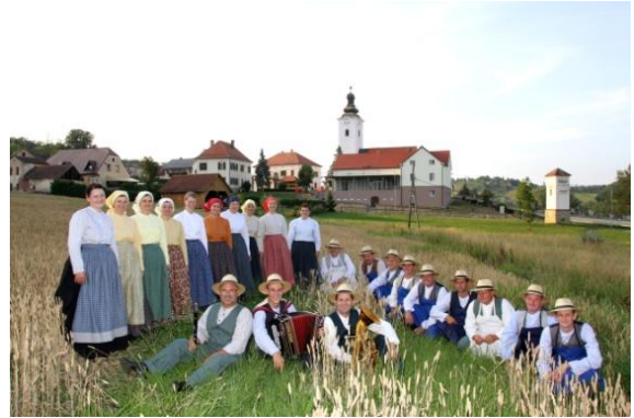
Slika 86: Jurovski Dol, 21. julij 2013.

Projekt nabave delovnih oblačil je skoraj v celoti financirala Občina Sv. Jurij v Slovenskih goricah, delno pa Javni sklad Republike Slovenije za kulturne dejavnosti.