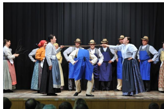
Slika 69: JAZ SI BOM PA METLO DELO – regijsko srečanje odraslih FS. (Makole, 19. maj 2013.)