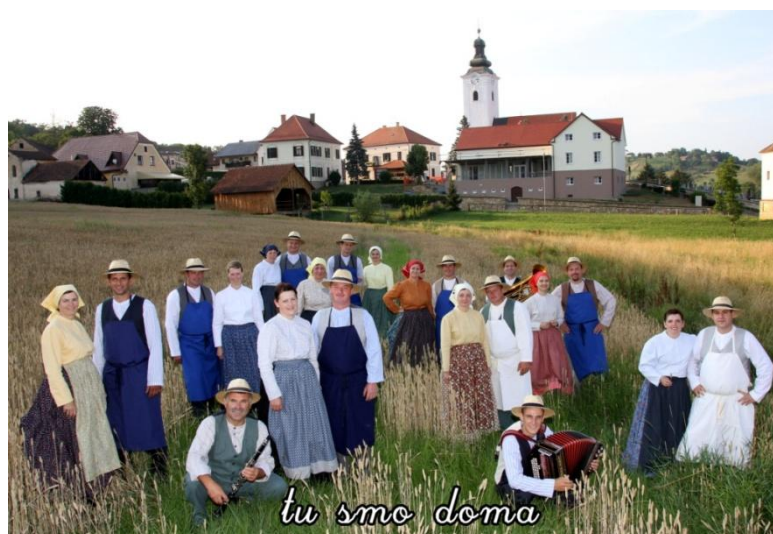
Slika 134: Folklorniki FS Jurovčan. (7. julij 2013.)