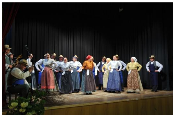
Slika 68: JAZ SI BOM PA METLO DELO – regijsko srečanje odraslih FS. (Makole, 19. maj 2013.)