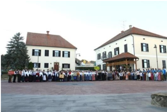
Slika 112: Skupinska fotografija nastopajočih FS.