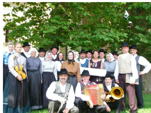
Slika 55: Pred nastopom. (Beltinci, 31. julij 2005.)