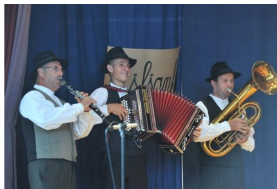
Slika 65: PUŠL ŠANK – regijsko srečanje odraslih FS. (Cirkovce, 5. junij 2011.)