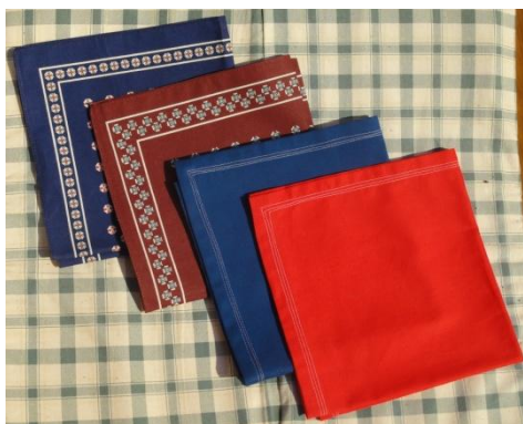
Slika 81: Delavski robčki.

Ženske so takrat nosile drukane kikle na pas z drobnimi belimi rožicami (drukan fürtoh), spodnje belo in rdeče ali sivo itn., progasto spodnje krilo. Pokrite so bile z bombažnimi rutami.