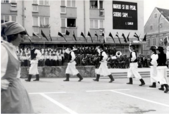
Slika 11: Otvoritev spomenika NOB. (Lenart, 1976.)