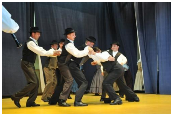
Slika 67: PUŠL ŠANK – regijsko srečanje odraslih FS. (Cirkovce, 5. junij 2011.)