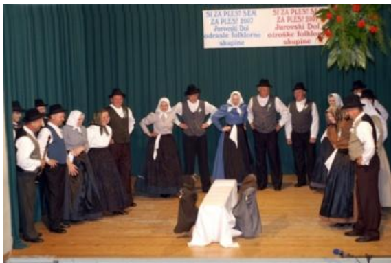
Slika 58: Igra mejaši – območno srečanje odraslih FS. (Jurovski Dol, 20. april 2007.)