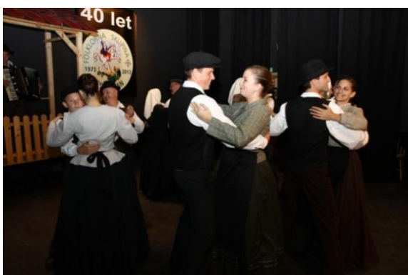
Slika 116: FS Moščanci.