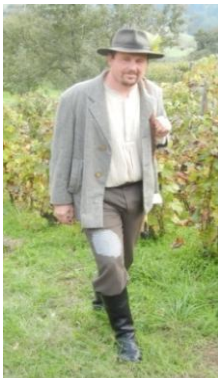
Slika 76: Ovtar med varovanjem vinogradov.