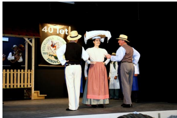
Slika 118: FS Jurovčan.