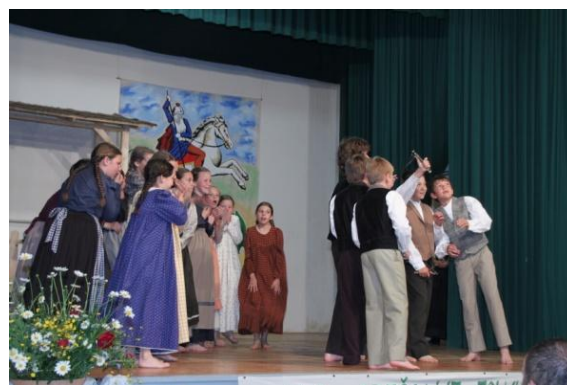
Slika 106: OŠ Jožeta Hudalesa FS Šleka pac.