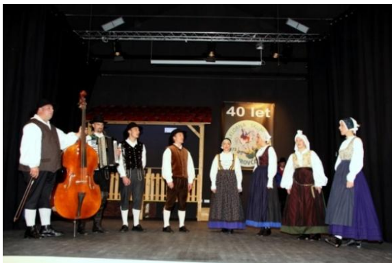
Slika 114: FS Karavanke iz Tržiča.