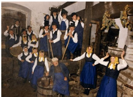
Slika 14: Utrinek iz vinske kleti na domačiji Zelenko. (Zg. Partinje, oktober 1986.)