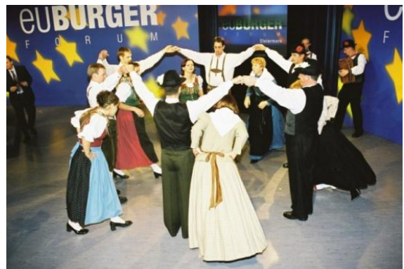
Slika 33: EU - BURGER – forum, ORF - Graz. (6. november 2003.)