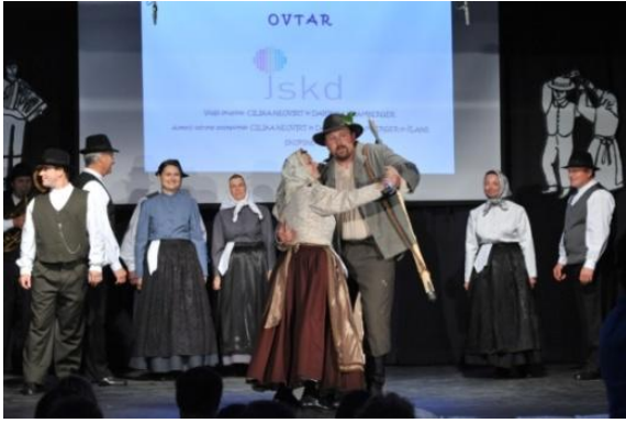
Slika 74: OVTAR – regijsko srečanje odraslih FS. (Podgorci, 3. junij 2012.)