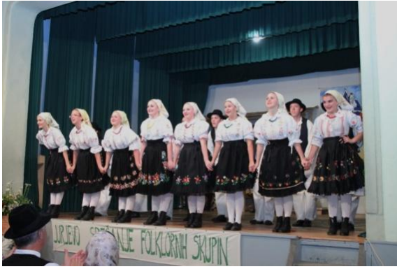
Slika 109: FS KUD KLARUŠ Maruševac, Hrvaška.