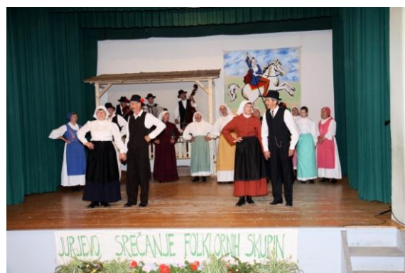
Slika 103: Veteranska FS KUD Beltinci.