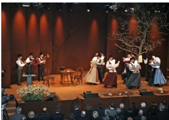
Slika 87: Osrednja državna proslava ob dnevu Rudolfa Maistra. (Lenart, 24. november 2006.)

Nastopili smo na RTV Slovenija, v oddaji NA ZDRAVJE. V samostojnem programu in igranju naših godcev v živo, smo predstavili odrsko postavitev ORAČI. Ostale skupine so večinoma plesale le spremljevalno.