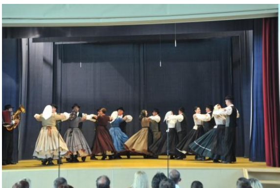
Slika 64: PUŠL ŠANK – regijsko srečanje odraslih FS. (Cirkovce, 5. junij 2011.)