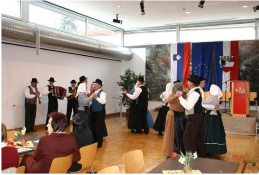
Slika 46: Slowenischer Kulturabend. (Neuhofen an der Ybbs v Spodnji Avstriji, 19. april 2008.)