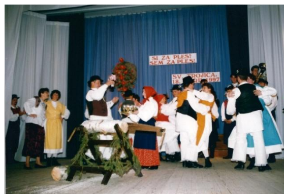
Slika 22: Občinsko srečanje FS. (Sveta Trojica, 18. april 1997.)