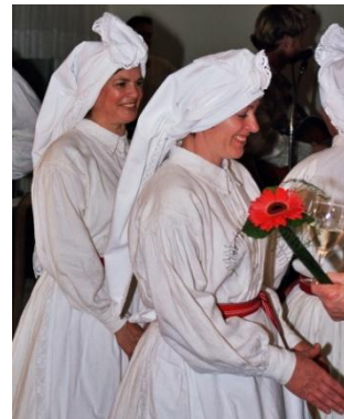
Slika 49: Cerkvjenjak, 15. 1. 2005.