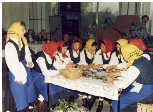
Slika 15: Luščenje semena v hotelu Slavija Maribor.