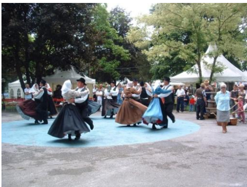
Slika 42: Srečanje treh dežel Avstrije, Italije in Slovenije. (Baernbach, 17. junij 2006.)