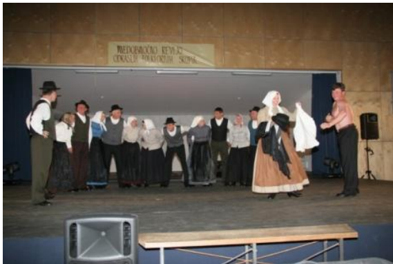
Slika 56: DOMLANKE – regijsko srečanje odraslih FS. (Zg. Ložnica, 6. maj 2006.)

Z odrsko postavitvijo JAZ SI BOM PA METLO DELO smo prikazali, kako so včasih na kmetijah izdelovali metle iz brezovih vej. Domiselno smo jih uporabiti tudi pri plesu.