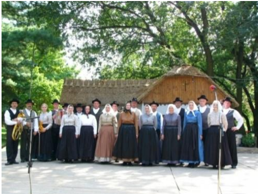
Slika 52: Pred nastopom. (Beltinci, 31. julij 2005.)

Odrska postavitev je nastala na podlagi terenske raziskave krajevnih običajev. Za potrebe odrskih postavitvev jo je opravil Miroslav Breznik. Odrsko postavitev sta s strokovno pomočjo gospe Nežke Lubej oblikovala Cilka Neuvirt in Miroslav Breznik.