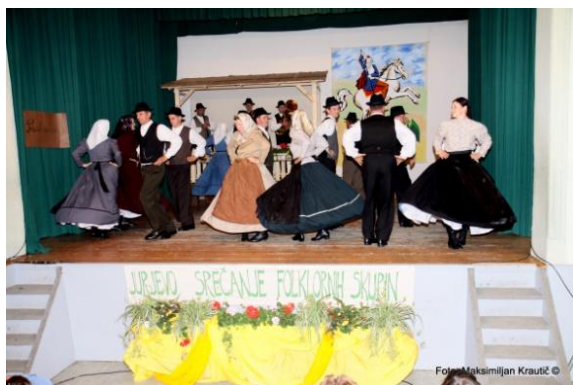
Slika 104: FS Jurovčan.