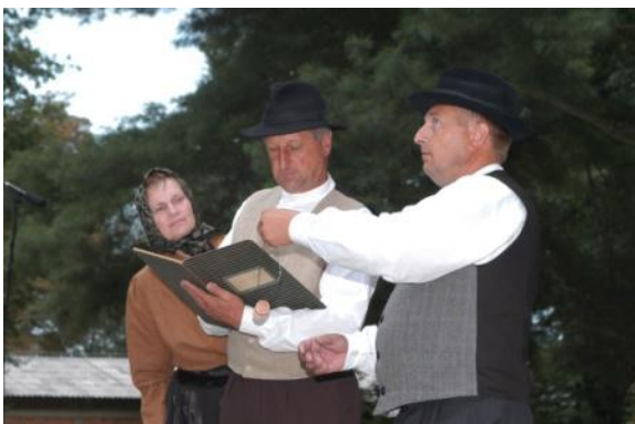
Slika 54: Med obračunom. (Beltinci, 31. julij 2005.)