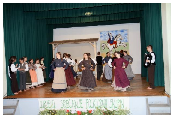
Slika 99: Otroška in mladinska FS OŠ Jožeta Hudales.