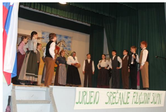
Slika 94: Otroška in mladinska FS OŠ Jožeta Hudalesa.