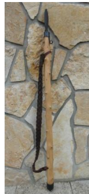
Slika 78: Ovtarska palica.