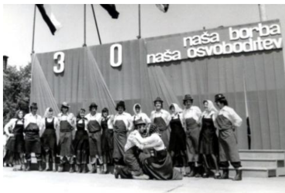
Slika 6: Osrednja občinska proslava ob 30-letnici osvoboditve. (Sveta Trojica, 1975.)