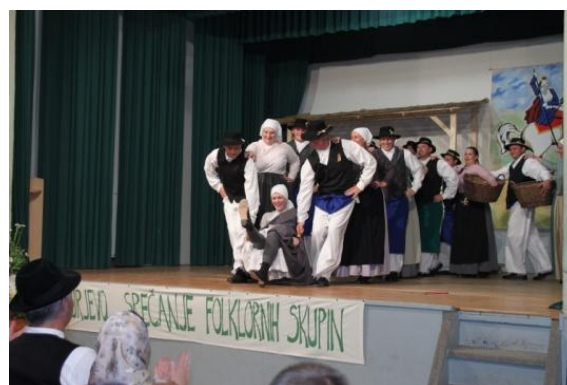
Slika 108: FS Metla - Miklavž pri Ormožu.