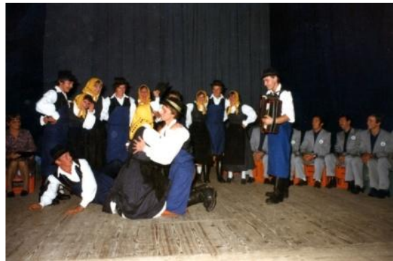
Slika 13: Med plesom pojštr tanca. (Brus, 1982.)

Folklorna skupina je prvič nastopila izven Slovenije leta 1982. Gostovala je v Srbiji, v mestu Brus, pobrateni občini z občino Lenart. Kasneje pa tudi v Zlatar Bistrici, v sosednji Hrvaški. Med pobratenimi občinami je takrat potekalo sodelovanje na političnem, šolskem, gospodarskem in kulturnem področju. Leta 1993 je skupina gostovala v Avstriji, v kraju Stradel.