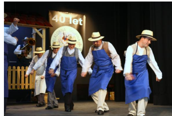
Slika 119: FS Jurovčan.