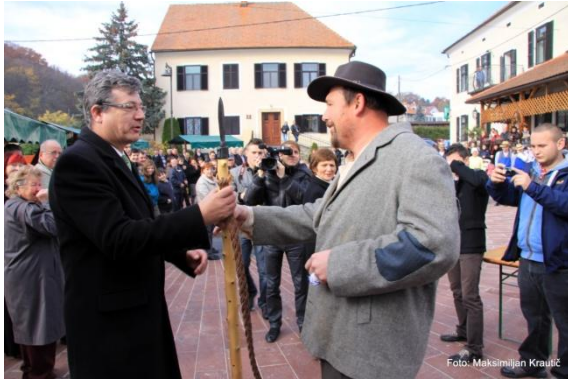
Slika 85: Martinovanje (Jurovski Dol, 11. november 2012).