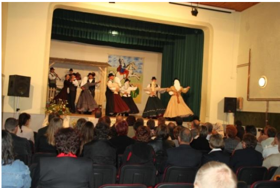
Slika 111: FS Jurovčan.