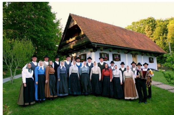
Slika 24: Jurovski Dol, 25. maj 2008.