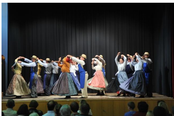
Slika 70: JAZ SI BOM PA METLO DELO – regijsko srečanje odraslih FS. (Makole, 19. maj 2013.)