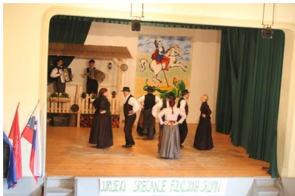
Slika 93: FS Sveta Ana.