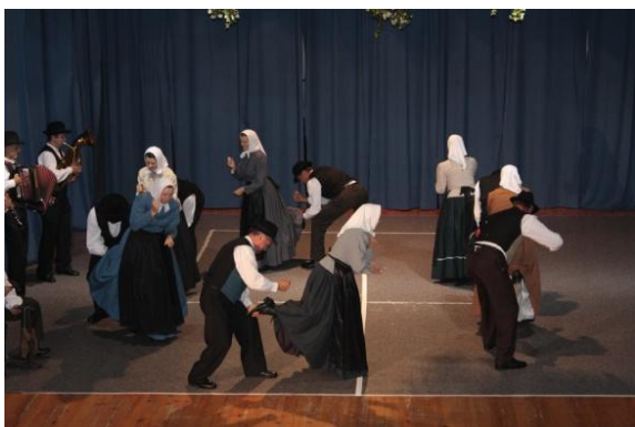
Slika 62: NA ŠTERO – regijsko srečanje odraslih FS. (Lenart, 22. maj 2009.)