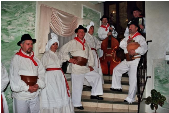
Slika 48: Cerkvjenjak, 15. 1. 2005.

Za nastop ob praznovanju osebnega jubileja članice folklorne skupine smo delno dopolnili naša stara belokranjska oblačila.