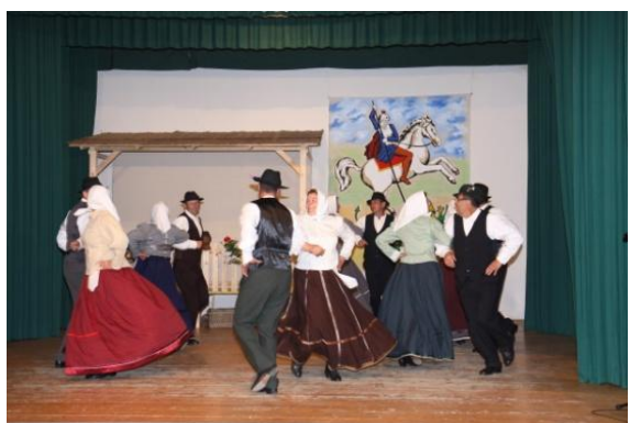
Slika 102: FS Cerkvjenjak.