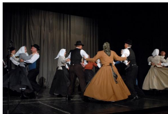
Slika 61: Regijsko srečanje odraslih FS. (Ormož, 3. junij 2008.)