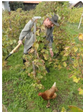
Slika 77: Ovtar je moral preganjati tudi kokoši.