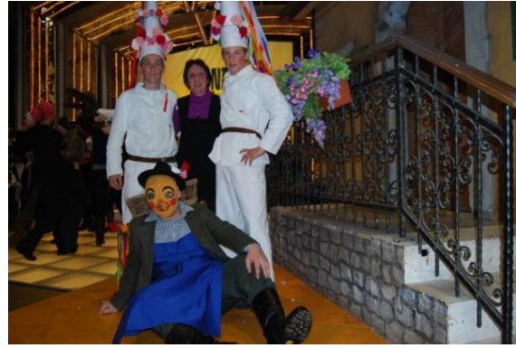
Slika 90: RTV Slovenija NA ZDRAVJE. (Ljubljana, 10. februar 2009.)