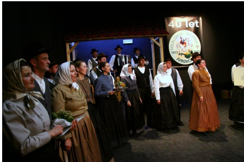
Slika 136: 40-letnica FS Jurovčan, podeljevanje priznanj.