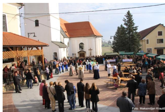
Slika 84: Martinovanje (Jurovski Dol, 11. november 2012.)