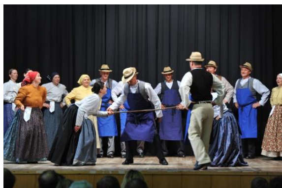
Slika 71: Prikaz šaljive igre z metlinim štilom. Regijsko srečanje odraslih FS. (Makole, 19. maj 2013.)