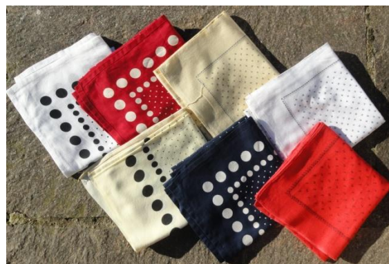
Slika 82: Delavske rute.