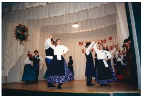
Slika 21: Srečanje FS občine Lenart. (Jurovski Dol, 22. marec 1996.)