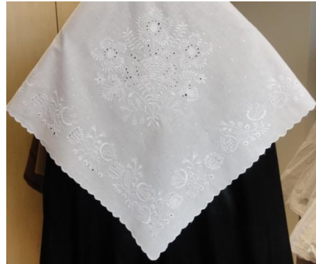
Slika 27: Peča ročno vezena po vzorcu še originalne peče.