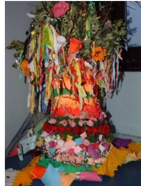
Slika 35: Pozvačinovo okrašeno pokrivalo - maska. (Eisenstadt, 26. oktober 2004.)