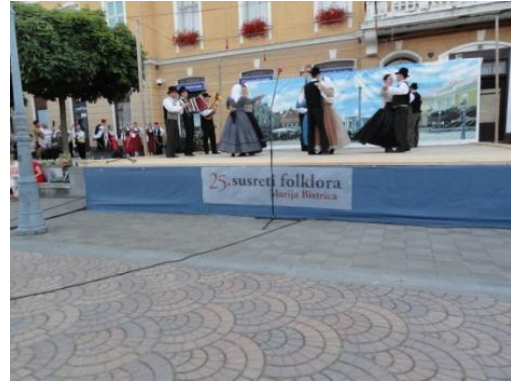
Slika 123: 25. Susreti folklor Marija Bistrica. (Hrvaška - Marija Bistrica, 9. julij 2011.)