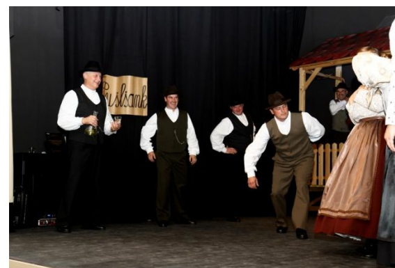
Slika 121: FS Jurovčan.