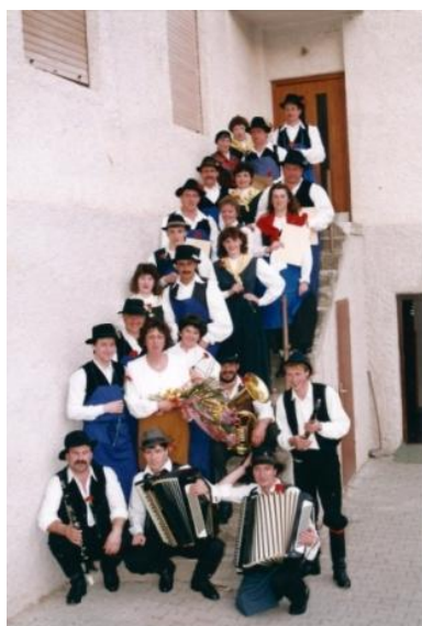
Slika 17: Obeležitev 20. obletnice FS.