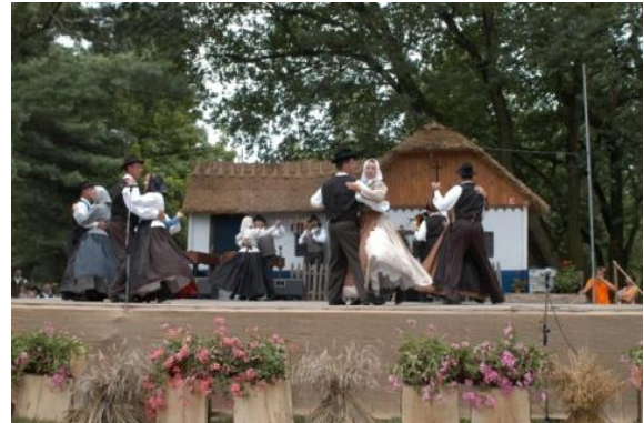
Slika 53: Med nastopom. (Beltinci, 31. julij 2005.)