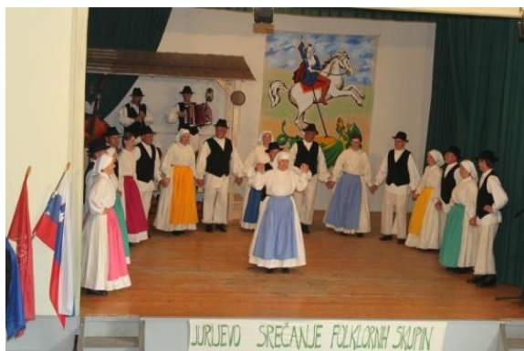
Slika 97: FS Jurovčan.