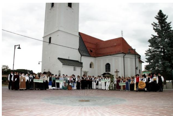
Slika 105: Skupinska fotografija vseh nastopajočih skupin.