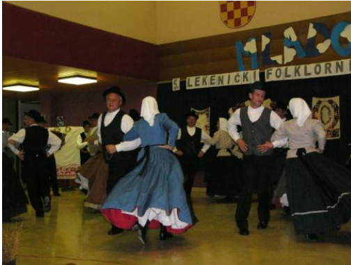
Slika 122: 5. Lekenički folklorni susreti. (Hrvaška - Lekenik, 3. oktober 2009.)