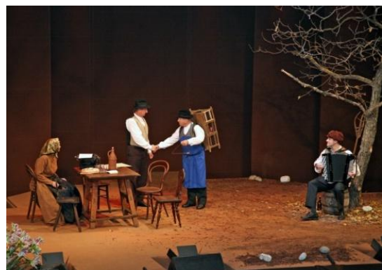
Slika 88: Osrednja državna proslava ob dnevu Rudolfa Maistra. (Lenart, 24. november 2006.)