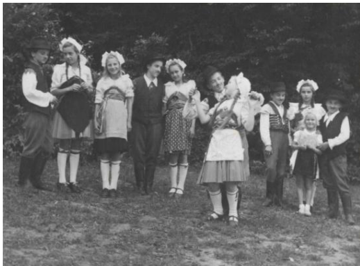
Slika 1: Otroška FS Koroški rej. (Leta 1951.)

V skupini je sodelovalo 31 mladink in mladincev. Plesali so prekmurske, srbske in druge plesne. Nastopali so na proslavah v domačem kraju in v sosednjem Lenartu. Delovala je tudi otroška pionirska folklorna skupina (Kolo časa – Zbornik ob 230 letnici šolstva v Jurovskem Dolu, 2004).