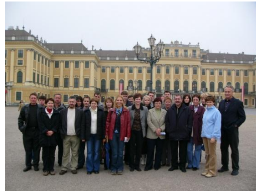
Slika 37: Dunaj, 26. oktober 2004.