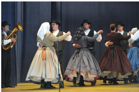
Slika 66: PUŠL ŠANK – regijsko srečanje odraslih FS. (Cirkovce, 5. junij 2011.)