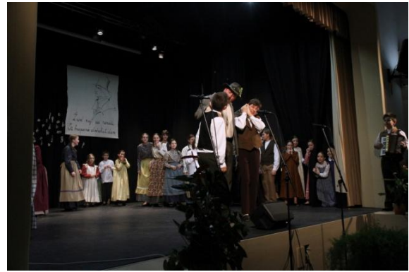
Slika 127: Otroški FS OŠ Jožeta Hudalesa Knofeki in Šleka pac.