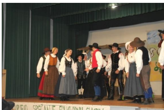
Slika 107: FS Triglav Slovenski Javornik - Jesenice na Gorenjskem.