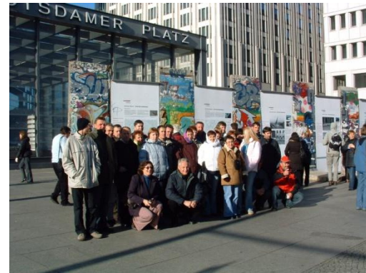
Slika 45: Ogled Berlina

Nastopili smo tudi v kraju Neuhofen an der Ybbs v Spodnji Avstriji na otvoritvi razstave o Slovenskih goricah. Celoten program prireditve sta pripravila in izvedla naša folklorna skupina in vokalni kvintet Završki fantje.