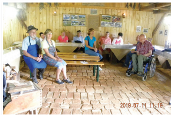
Pa smo šli "k njim na tavr" – obisk Ekološke kmetije Pri Fridi