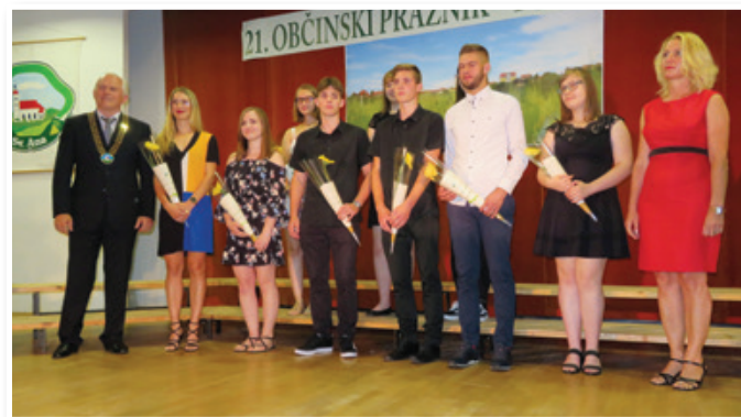
Najboljšim dijakom in študentom iz območja Občine Sveta Ana so podelili denarne nagrade.