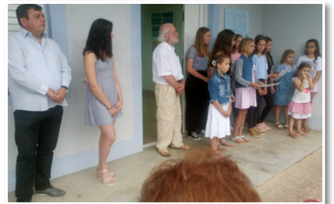
Udeleženci delavnice z županom Nevenom Komadino ob odprtju razstave v Županjah.

Gre za projekte mednarodnih razsežnosti; vedno večje je zanimanje za udeležbo in podporo na Krku, zato bi bilo prav, da bi nas enako podpirali tudi predstavniki domače Občine Lenart in