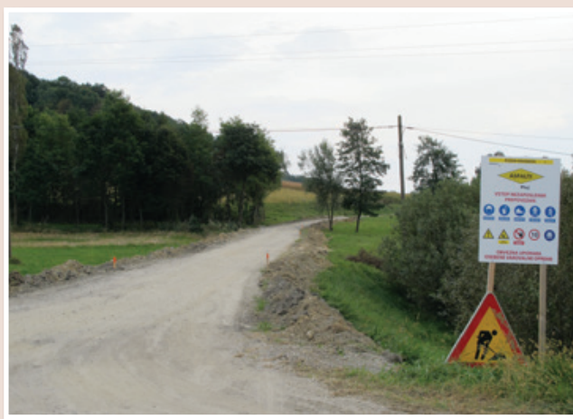
Občine upravljajo le z lokalnimi cestami in javnimi potmi (po dolžini je teh največ), medtem ko so za vzdrževanje in modernizacijo vseh drugih cest odgovorni bodisi na Direkciji Republike Slovenije za infrastrukturo ali na Družbi za upravljanje avtocest (DARS).