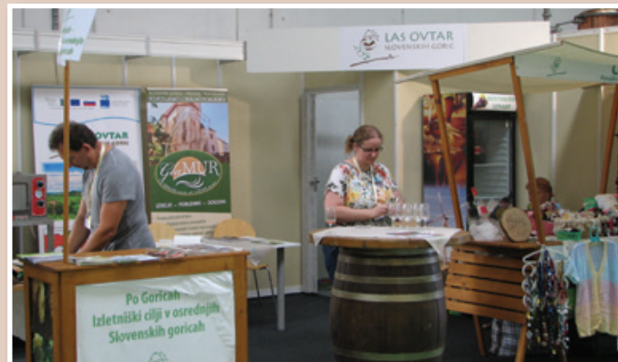
Stojnica LAS Ovtar na Agri 2019