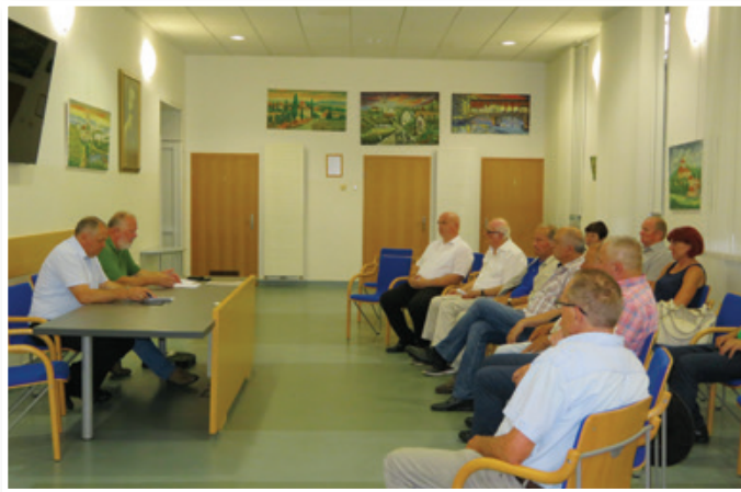
Na okrogli mizi ob jubileju Slovenskogoriškega foruma so njegovi člani ovrednotili njegovo delovanje in rezultate dela foruma v minulih 20 letih.