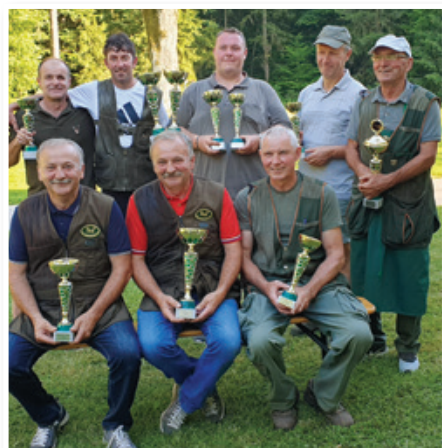
Zmagovalci Dobrave 2019.