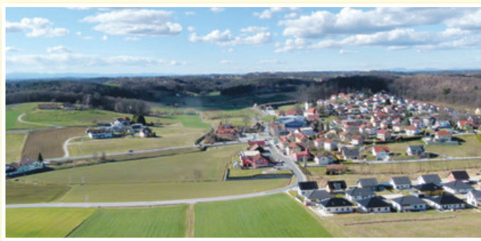
Kmetijska kulturna krajina ob naselju Benedikt

V prejšnji številki našega časopisa smo opisali začetek in potek operacije Ekomuzej Dolina miru Benedikt, ki bo vseboval in povezoval prostor, dediščino, spomin in prebivalce na vsem ozemlju Občine Benedikt. Pripravljena imamo logotipa in slogana za destinacijsko blagovno znamko Benedikt in za produkt Ekomuzej. Zaradi tople in suhe zime smo lahko evidentirali, fotografirali in opisali večino izvirov, mokrišč, vlažnih gozdov in drugih naravnih in kulturnih znamenitosti na ozemlju Ekomuzeja. Določili smo osem novih zelenih površin, namenjenih za rekreacijo.