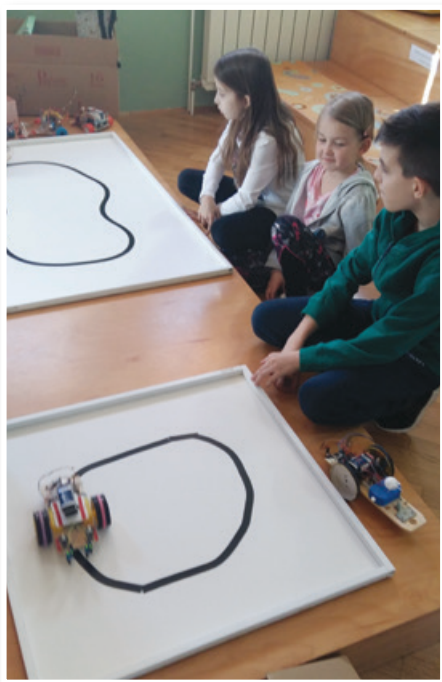
Ena od »ekip« med delovanjem avtorobotkov