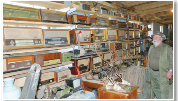
Anton Sever in del njegove muzejske zbirke