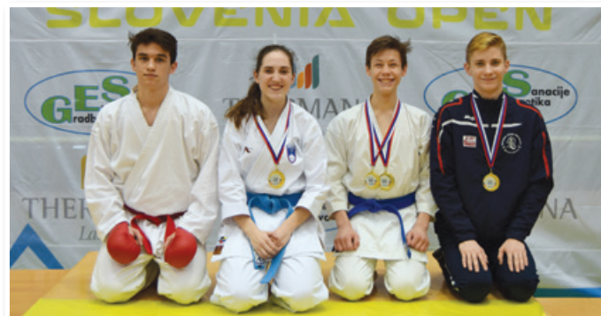
Ekipa v Laškem