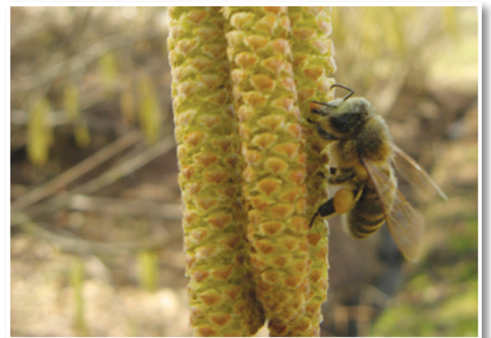
Leska – medoviti grm, ki nas jeseni razveseljuje s svojimi plodovi – lešniki.