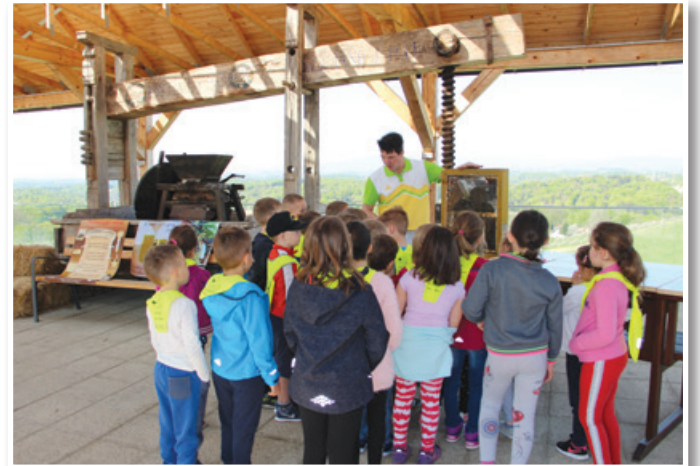
Dan odprtih vrat ČD Sveta Ana 2018

Obveščamo vas, da bo v petek, 26. aprila 2019, potekal zdaj že tradicionalen Dan odprtih vrat Čebelarskega društva Sveta Ana. Vljudno vabimo vse, ki bi želeli izvedeti kaj več o čebelarstvu, pomenu čebel in čebeljih pridelkov, da se nam pridružite in spoznate delo slovenskih čebelarjev. Z zavedanjem o pomenu čebel za naše okolje in življenje lahko vsak posameznik in tudi širša družbena skupnost naredi korak naprej za ohranitev naravnega okolja, čebel in s tem opravevanja, ki je bistvenega pomena za zadostno lokalno samooskrbo s prehrano. Vabljeni torej, da se 26. aprila pridružite slovenskim čebelarjem, ki vam bomo z veseljem pokazali in predstavili pomen našega dela. Čebelarsko društvo Sveta Ana bo svojo