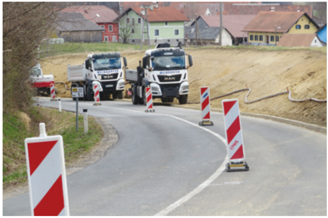
Dela pri modernizaciji ceste in izgradnji pločnika ter javne razsvetljave skozi Spodnjo Senarsko so v polnem teku.