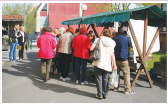
Bazar semen in sadik april 2018

Za vsa dodatna vprašanja nas pokličite na telefonsko številko 02 720 78 88, 051 368 118 ali nam pišite na elektronski naslov: izobrazevalnicenter.slogor@gmail.com. Lepo vabljeni.