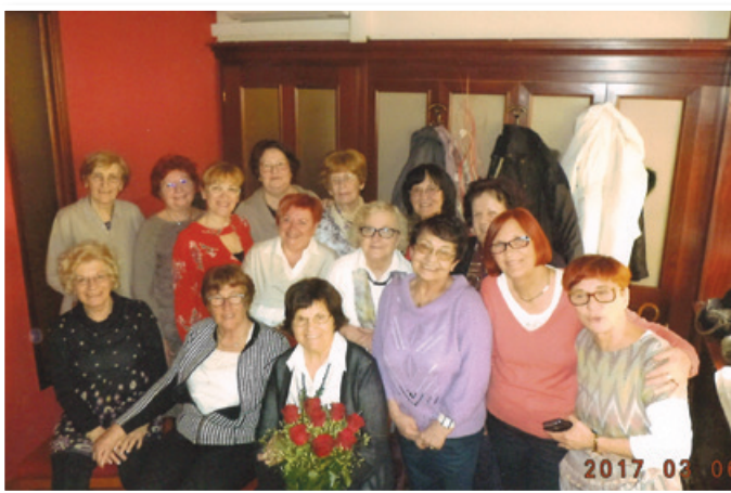
Upokojenke OŠ Lenart