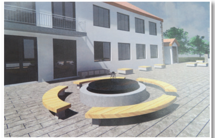
Tako bo videti središče Cerkevjak po ureditvi novega trga pred Kulturnim domom in občinsko zgradbo.