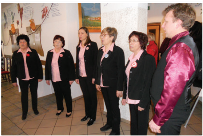
Ljudski pevci Žitni klas iz DU Benedikt