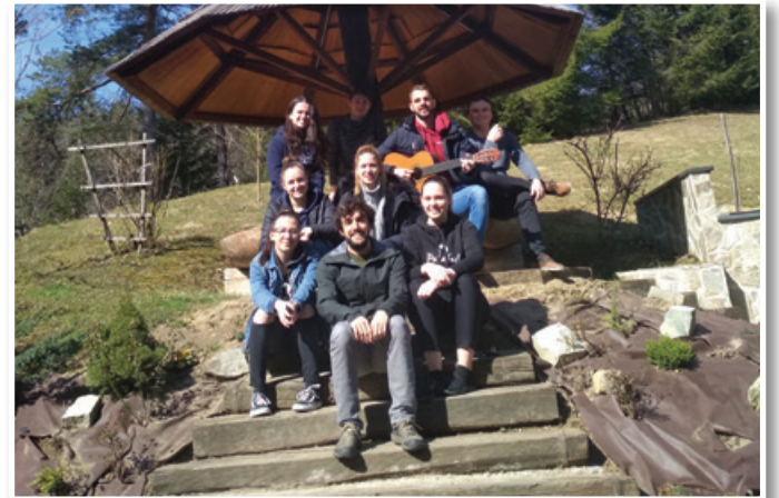
Člani Upravnega odbora Študentskega kluba Slovenskih goric na delovnem vikendu