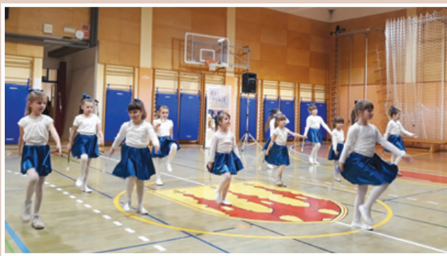
Nastop ormoških mažoret