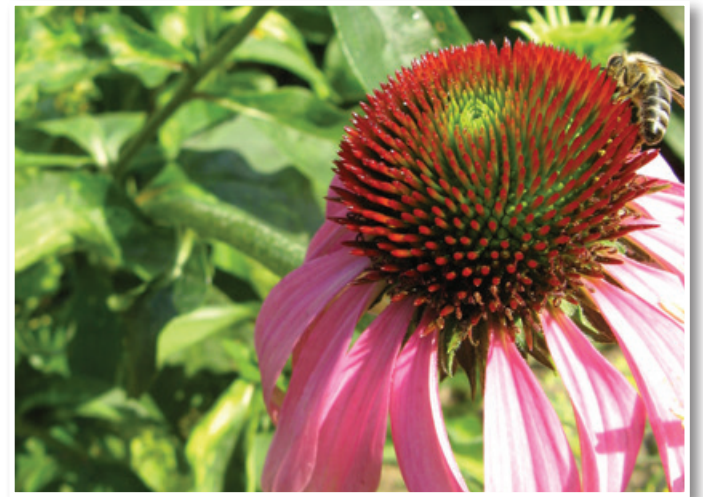
Ena od medovitih rastlin je ameriški slamnik.