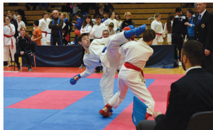
Vid (levo) v Velenju