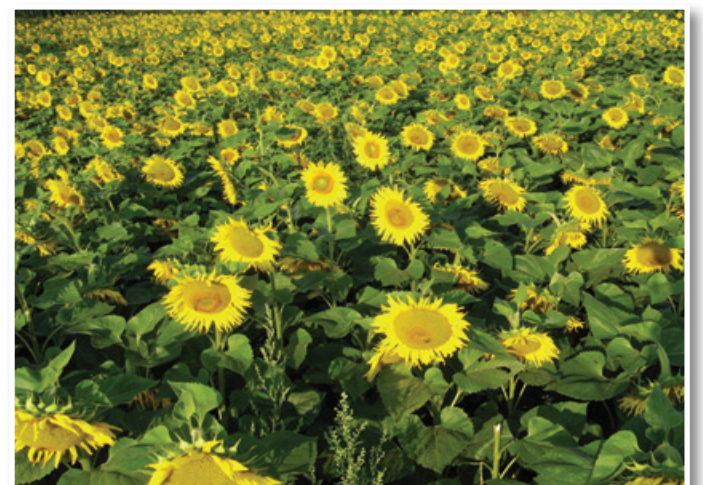
Polje sočnic, ki čebelarjem zagotavljajo medicino in cvetni prah.