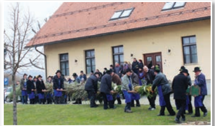
Izdelava presmecev v naselju Radehova in v KS Voličina in postavitve ob lenarško in voličinsko cerkev sta se že zdavnaj zasedrila v tradicijo. Turistično društvo Radehova in Turistično društvo Presmec Dolge Njive sta ji letos dodala novo poglavje. Radehovski presmec je prepeljala kolona koles, 22-metrskega z Dolgih Njiv pa konjska vprega.