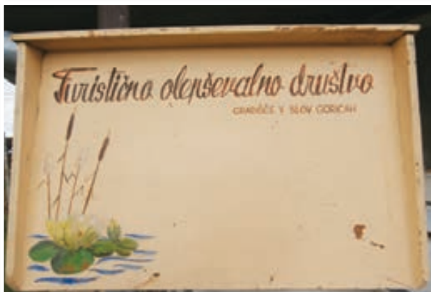
Prva oglasna deska TOD Gradišče v Slov. gor. iz leta 1968