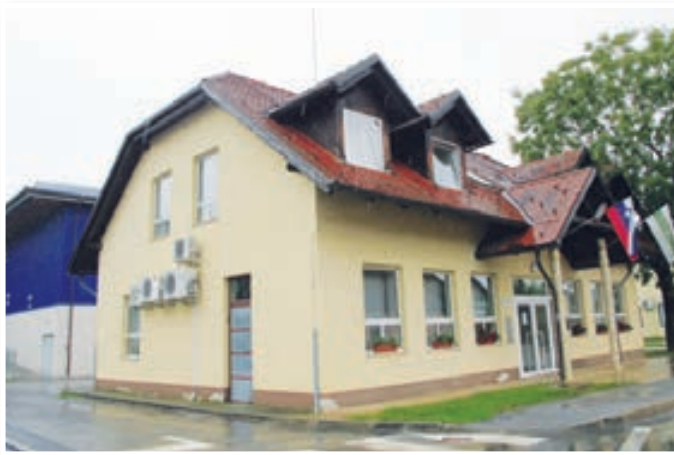
Občinski svet se ni odločil za izvedbo investicijskega dela projekta »Muzej na prostem Benedikt«, v okviru katerega so načrtovali tudi postavitev oziroma rekonstrukcijo nekdanjega Čolnikovega kozolca.

ponovni postavitvi za javne potrebe nekje v središču Benedikta.