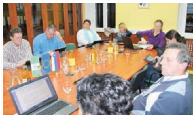
Utrinek z 11. redne seje OS Občine Sveta Ana