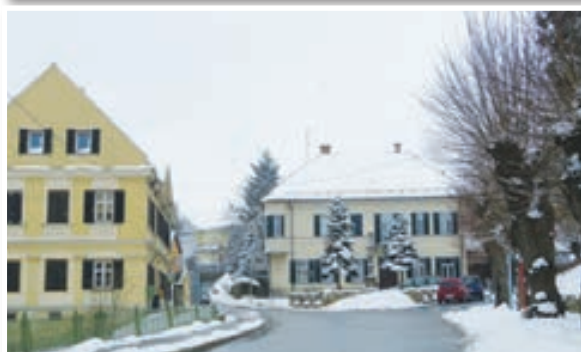
Sveta Trojica je bila po presoji pristojnih inšpektorjev minulo leto vedno urejena in čista.