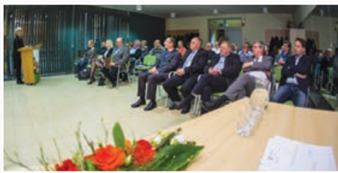
Slovesnost ob 10. obletnici delovanja društva

Javna zahvala je bila izrečena tudi vsem članom in gostom slovesnosti za njihov prispevek v društvu. Brez aktivnih članov in iskrene podpore deležnikov na lokalni ravni bi bili