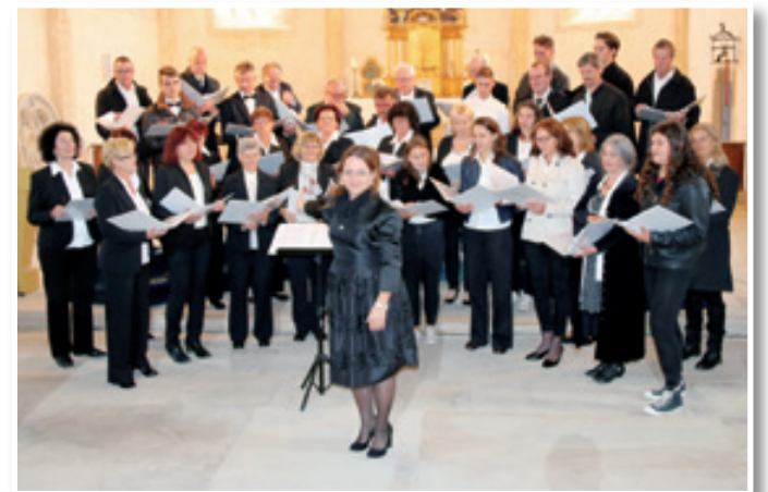
Župnijski pevski zbor župnije sv. Benedikta ob nastopu na dekanjskem srečanju župnijskih pevskih zborov v cerkvi Sv. Treh kraljev pri Benediktu