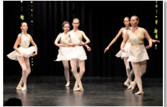
Baletke lenarške glasbene šole

zraven, da znaš, da veš, da ti že boš ...« O delu JSKD Lenart je dejala: »Naša izpostava je v svojih dvajsetih letih dokazala, da je vredna zaupanja. Stkale so se vezi. Še posebej v