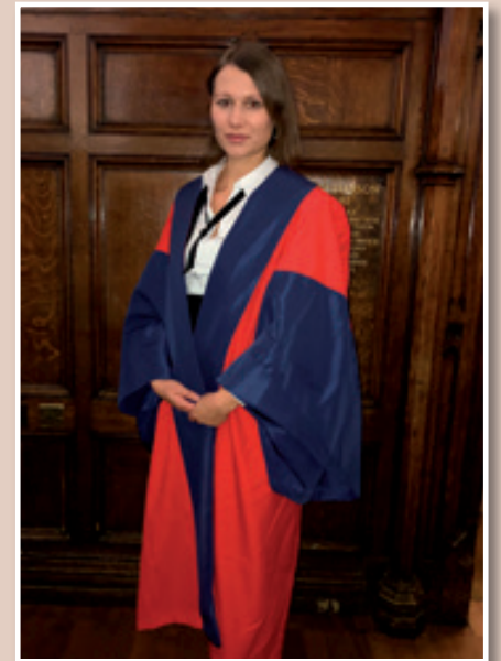
S podelitve doktorata v Oxfordu

Od leta 2012 do danes je kot raziskovalka sodelovala na številnih fakultetah v Sloveniji in tujini, med njimi na Pravni fakulteti Univerze v Oxfordu, Evropskem univerzitetnem inštitutu v Italiji, Inštitutu Maxa Plancka za primerjalno in mednarodno zasebno pravo v Hamburgu in Pravni fakulteti Univerze na Dunaju ter kot pripravnica in pravna svetovalka na Sodišču EU v Luksemburgu. Leta 2013 je opravljala delo sodniške pripravnice na Višjem sodišču v Ljubljani, v času doktorskega študija pa je raziskovalna in delovne izkušnje nadgrajevala kot asistentka in gostujoča predavateljica na Pravni fakulteti Univerze v Oxfordu, na Dunaju in na domačih fakultetah. Zdaj je zaposlena kot docentka na katedri za