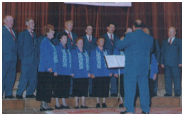
Nastop mešanega pevskega zboru DI Lenart leta 1999 na Vrhniki

Do polne vključenosti invalidov ter oseb s posebnimi potrebami bo treba v mnogih pogledih še veliko narediti. Vse se ne da čez noč, povedo na Ministrstvu za delo, družino, socialne zadeve in enake možnosti, saj je potrebno za ta namen vpeljati kar nekaj pravnih aktov, še dodajajo.