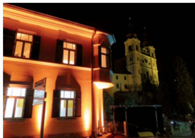
»Trojiška lepotic« bo spremenila tudi veduto kraja, še zlasti v nočnem času.