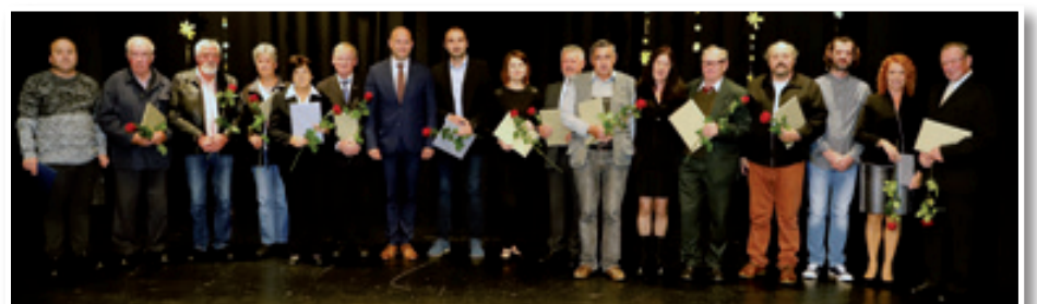
Jubilejna priznanja posameznikom in dvema institucijama