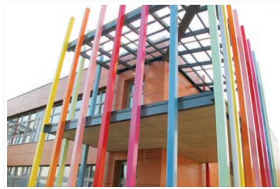
V prejšnji evropski finančni perspektivi je občina Benedikt s pomočjo sredstev iz Evropske unije zgradila nov vrtec, ki so ga nujno potrebovali.

V prejšnji evropski finančni perspektivi se je občina Benedikt izredno hitro razvijala tudi zahvaljujoč sredstvom, ki jih je za določene investicije in razvojne programe občina uspela pridobiti iz bruseljske blagajne. Tako je občini Benedikt po besedah Gumzarja v preteklosti na razpisih uspelo pridobiti evropska sredstva za izgradnjo in modernizacijo cest, za izgradnjo kanalizacije in vodovoda, za izgradnjo novega vrtca in še bi lahko naštevali. V prejšnji finančni perspektivi je namreč Evropska unija znatna sredstva namenila za sofinanciranje komunalne infrastrukture v lokalnih skupnostih, kar je bilo »napisano na kožo« potreb ljudem tudi v manjših podeželskih občinah.