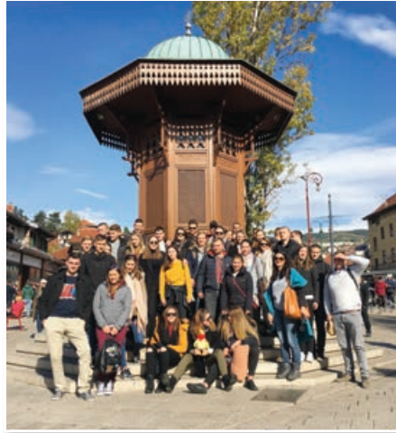
V Sarajevu ...

Dneve med 28. 10. in 30. 10. smo ŠKSG-jevci preživel na tradicionalnem jesenskem izletu, tokrat v Bosni in Hercegovini. Prvi dan smo si ogledali Mostar, skrivnostni Titov bunker v Konjicu in nato dvakrat prenočili v Sarajevu. Dnevi so bili polni zabave, smeha, prijetnega druženja in seveda čevpčičev. Zadnji dan je bil na sporedu še ogled mesta Travnik in rojstne hiše Iva Andrića ter mesta Jajce. Vožnja domov je hitro minila in tudi čakanje na meji nas ni spravilo v slabo voljo.