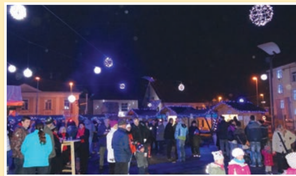
Tako je bilo lani ...

Vabljeni, da sejem obiščete in si popestrite praznične decembrske dni!