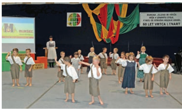
Bogat, domiseln, kakovosten in ganljiv program otrok in vzgojiteljic vrtca Lenart - najmlajši folkloristi