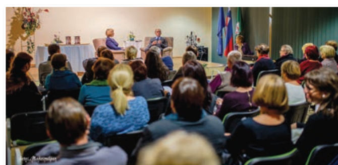
Obiskovalci so dvorano napolnili do zadnjega kotička.

zasedeni dvorani spominjali težkih, a tudi lepih trenutkov.