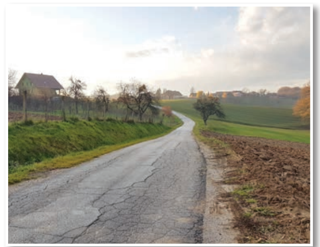
Razširitve in rekonstrukcije bo prihodnje leto deležna cesta v Vardi

Pred bližajočo se zimo so pogosta vprašanja o pripravljenosti izvajalcev zimskih služb, ki skrbijo za prevoznost lokalnih javnih cest. V jurovskem občinskem proračunu je predvidenih 40.000 € proračunskih sredstev za izvajanje zimskih služb, kar bi naj glede na zadnji