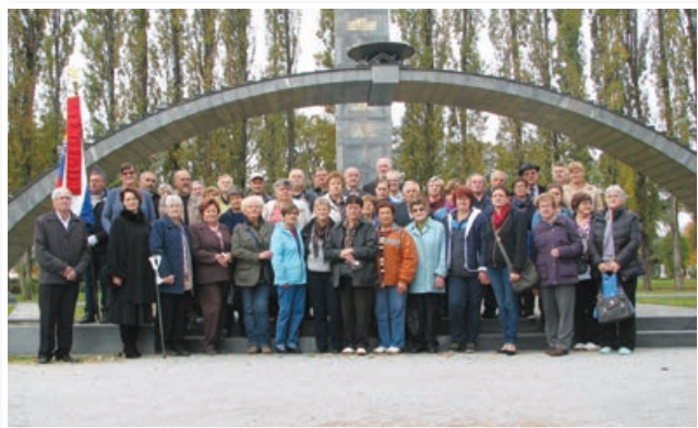
Udeleženci komemoracije pred graškim spomenikom s predsednikom Državnega zbora RS in slovensko veleposlanico v Avstriji.

V nagovoru pred spomenikom žrtvam je dr. Brglez med drugim dejal: »Zbrali smo se, da se poklonimo vsem tistim, ki so za našo, slovensko domovino žrtvovali svoja življenja. 72 let po koncu najhujše morije v sodobni zgodovini Evrope si mnogi izmed nas le stežka predstavljamo, v kakšnih razmerah so v vojnih letih med 1941 in 1945 živeli naši ljudje. Bil je to čas, ko je bil človek človeku volk. Ko je preživel enega pomenilo smrt in izničenje drugega. In ne nazadnje, žal je bil to čas, ki je razgalil najtemnejše strasti, ki se skrivajo v slehernem posamezniku – čas noči in trpljenja, brezumja in krivic, čas zaslužnjevanja in zatiranja. A obenem so se takrat ponovno izkazale tiste vrednote, ki nas delajo ljudi. Vrednote solidarnosti, pomoči sočloveku, vrednote sočutja in predvsem prijatelj-