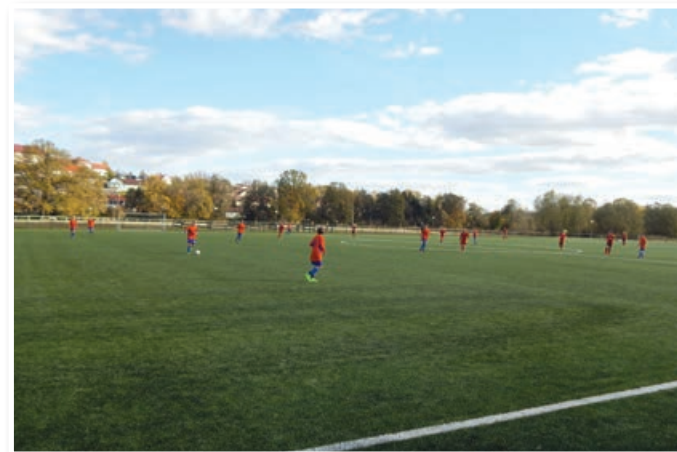
Tekme ob otvoritvi igrišča z umetno travo, foto arhiv NK Ajdas Lenart

predstavi Dino in čarobni toni je bilo otroške igrivosti in vesela v izobilju. Smej se, ko je le