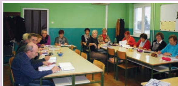
Učenje nemščine, I. sk.

Vključevanje starejših v izobraževanje je zelo pomembno, saj se promovirata vseživljenjsko učenje ter prenos znanja med generacijami.