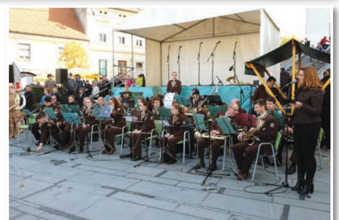
D. O.

Lenarško žegnanje je še vedno praznik, kot je bil nekdanj. Slovesne svete maše, ki dajo pečat nedelji. Žegnanje je predvsem praznik farnega zavetnika, je pa tudi družinski praznik, ko praznuje družina ob slovesno pogrjnjeni mizi. Dogajanje v Lenartu je bilo živahno, ponudba na stojnicah, lectovi srčki, lončena posoda, suha roba in druge stare obrti. Mošt in vino domačih vinogradnikov, dobrote kmečkih žena in deklet, izdelki raznih domačih društev. Predvsem pa kulturni program, ki je obogatil praznik in ob katerem je uživala množica ljudi. Hvala Slovenskogoriškemu pihalnemu orkestru MOL za ubrane melodije, vokalni skupini Il divji za lepe pesmi, članicam Twirlinga, plesnega in mažoretnega kluba Lenart za gracioznost in eleganco, Folklorni skupini Kulturnega društva sv. Ana za poskočne štajerske plesne.