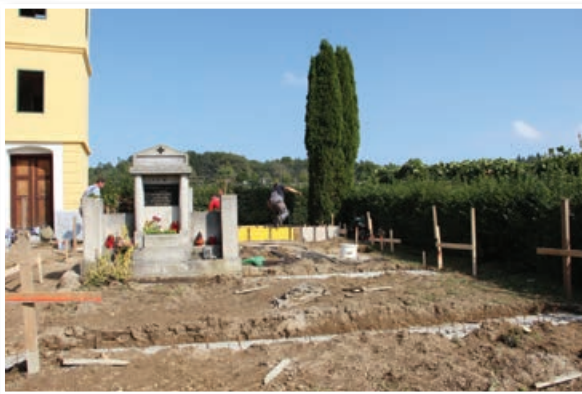
Pokopališče pred obnovo