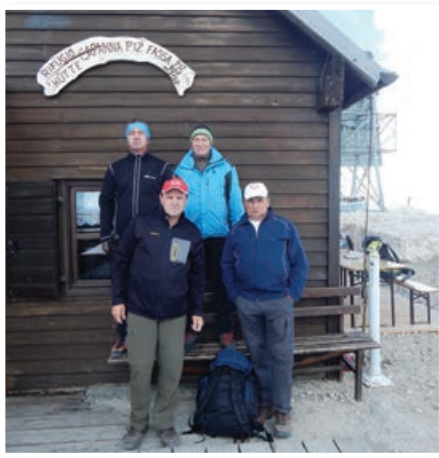
Člani »odprave« na vrhu Piz Boe (3152 m)

V bogatem in pestrem letnem programu pohodov, ki ga v PD Hakl izvajajo društveni planinski vodniki z veljavno licenco s strani PZS, je za leto 2017 načrtovanih 22, po zahtevnosti različnih pohodov. Posebej izstopata dva pohoda, ki sta bila organizirana v tuja gorstva. PD Hakl namreč spada med tista redkejša društva znotraj PZS, ki tradicionalno organizirajo pohode v italijanske Dolomite. Letošnji, petnajsti zapovrstjo, je potekal med 15. in 16. julijem po ferati Brigata Tridentina. Ta je speljana po severni strani na zelo obiskano goro Piz Boe (3152 m). Sestopili smo na prelaz Passo Pordoi. Tisti, ki so imeli priložnost že kdaj obiskati Dolomite, se radi vračajo na njihove vrhove, ki so zaradi drugačne geološke sestave že od daleč videti temnejši, bolj ošiljeni in prepadni od naših Julijcev ali Kamniško Savinjskih Alp, vendar v svojem »zakulisju« skrivajo obilo čudovitih planot, kjer te ostre oblike izgubijo svojo surovost in drznost. Kot taki pa so kot nalašč primerni tudi za »navadne« planince, med katere spadamo tudi mi.