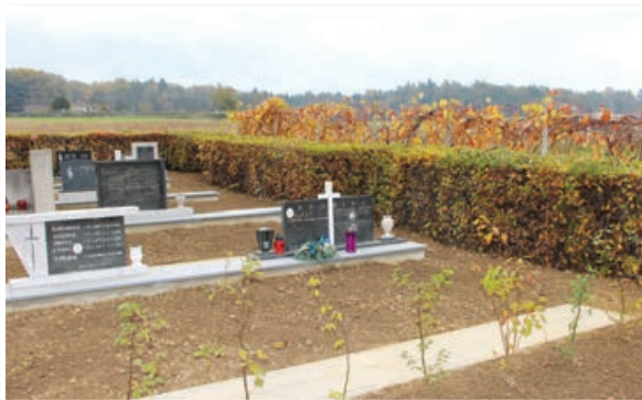
Pokopališče po obnovi