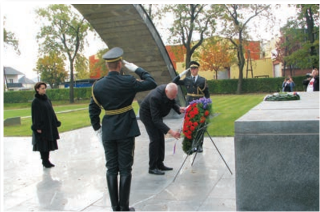
Slovenskim žrtvam 2. svetovne vojne na graškem pokopališču je venec položil tudi dr. Milan Brglez, predsednik Državnega zbora.