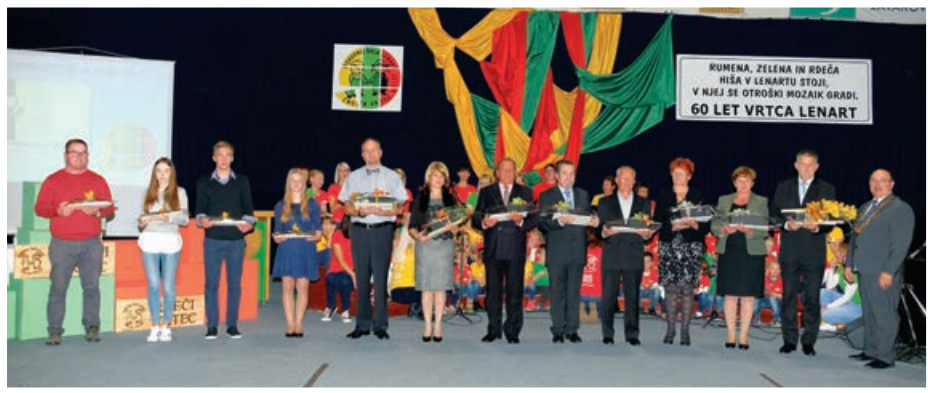
Prejemniki priznanj in nagrad Občine Lenart

Občina Lenart vsako leto podeli priznanja in denarne nagrade študentom, ki so svoje študijske obveznosti, vključno z diplomskim delom, magistrsko nalogo ali doktorsko disertacijo, opravili s povprečno oceno 9,1 ali