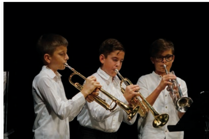
Jesenski koncert Glasbene šole Lenart

V Galeriji Konrada Krajncja je bila otvoritev razstave slik 12. Mednarodne likovne delavnice za mlade, ki je bila v poletnih mesecih na otoku Krku. Program razstave je popestril Adi Smolar. Likovno ustvarjalnost podpirajo tudi v VDC Polž - enota Lenart, otvoritev razstave slik, ki so jih ustvarili uporabniki VDC Polž je bila v Avli Jožeta Hudalesa. Tradicionalni koncert, ki so ga organizirali v lenarški enoti VDC Polž, na katerem