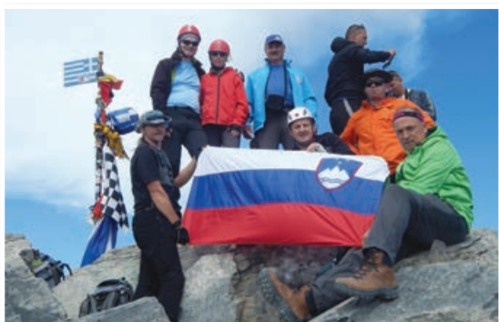
Na Mitikosu (2917 m)

V prvih sedmih dneh v septembru 2017 smo člani društva osvojili najvišjo goro Grčije – Olimp (2917 m). Ta čudoviti grški gorski masiv imenujejo tudi »gora bogov«, saj se po njih še danes »potika« dvanajst glavnih grških bogov in devetih muz, ki so povezani z grško mitologijo. Pogorje Olimp (v originalu imenovan Oros) sestavlja 52 vrhov, ki se razprostirajo v Unesco-