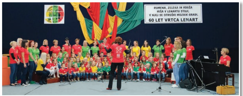
Združeni pevski zbor najmlajših zborovskih pevcev in vzgojiteljic