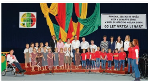
Otroci iz vrtca in varovanci VDC Polž – enota Mravljja Lenart so zapeli skupaj.