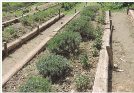
Za obrobe gred in druge podporne vrtno elemente lahko uporabimo naravne materiale.

Za prekrivanje pridelovalnih površin uporabimo zastirko iz sena ali slame, ki hkrati preprečuje rast plevelov, zadržuje vlagu, izboljšuje prst, zato tudi strojna obdelava ni potrebna. Za preproste vrtno ureditve, kot so obrobe gred in druge podporne vrtno elemente, lahko uporabimo reciklirane, naravne materiale. V sistem kmetovanja vključimo tudi koristne organizme ki jih privabimo z ustrezno urejenimi bivališči in viri hrane.