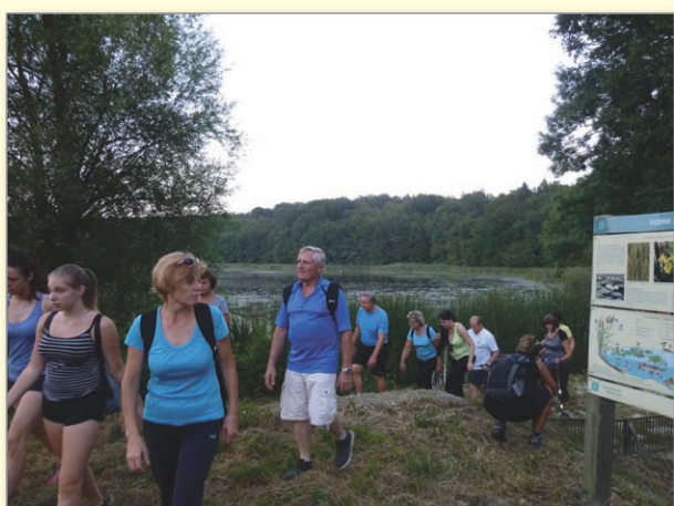
Pohodniki ob Komarniku