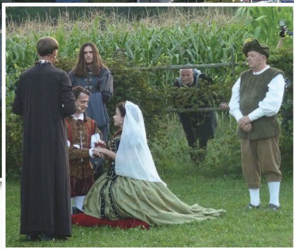
Agatine skrivnosti 2016 - Pohoda od ene do druge Agatine skrivnosti se je v soboto, 27. avgusta, udeležilo okrog 1000 pohodnikov. LAS Ovtar Slovenskih goric, RASG in Gledališka skupina KD Delavec Lenart so zastavljene načrte izpolnili več kot odlično. Pet odigranih prizorov zgodbe Skaljena ljubezen Agate in Friderika avtorice Berte Čobal Javornik je dokazalo visoko profesionalno izvedbo vseh elementov gledališke postavitve kot tudi organizacije pohoda. Več na strani 20.