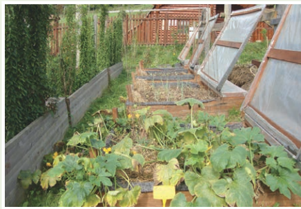
Grede za 365 dni nam omogočajo celoletno pridelavo, pozimi jih pokrijemo, poleti pa pustimo delovanje sonca in toplote na rastline.

S pomočjo agro-ekoloških ureditev v vrtu, na njivi ali celotni kmetiji se v največji možni meri prilagajamo naravnim dejavnikom in koristimo naravne lokalne obnovljive vire. Rabimo naravne vire, kot so sončna energija za ogrevanje vode in elektriko, zbiramo in ponovno rabimo vodne vire, kot je izvirska voda ali deževnica, energijo zemlje v zemljanki vključimo za shranjevanje semen in pridelkov. S tem zmanjšamo potrebo po zunanjih vnosih energije, zmanjšamo ter znižamo obratovalne stroške kmetovanja. Uporabimo viške biomase za namene kompostiranja in jo po letu dni vrnemo v grede. Kompost bo dodatno zadrževal vlagu, posledično bomo s tem izboljšali kakovost prsti.