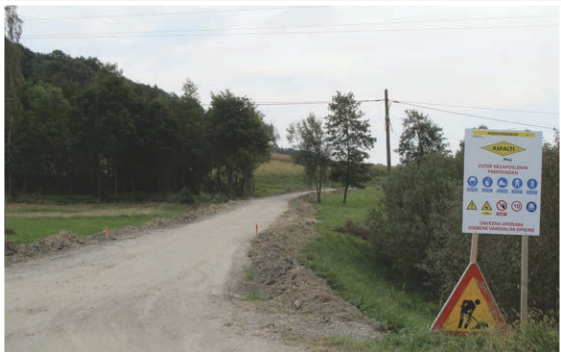
Gradnja ceste v Oseku