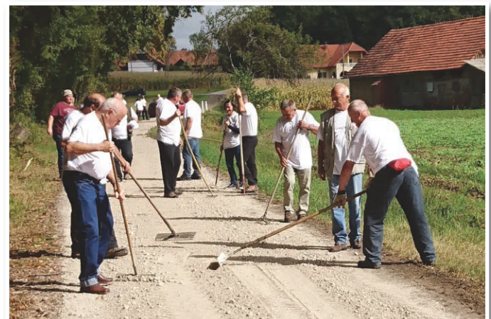
Idilični Rožengrunt in dobra skupina v sodelovanju sta bila spremljevalca uspešne akcije.

organizacijo dogodka, da so udeleženci prejeli tudi majice in pogostitev ob koncu dela. Vsem, ki so pomagali, gre za nekaj prostovoljnih dni, pa tudi denarja, iskrena zahvala.