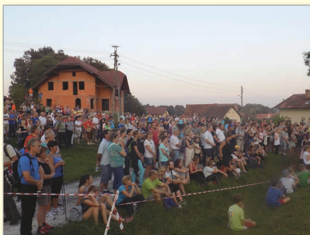
Množica ob kapelici v Lormanju