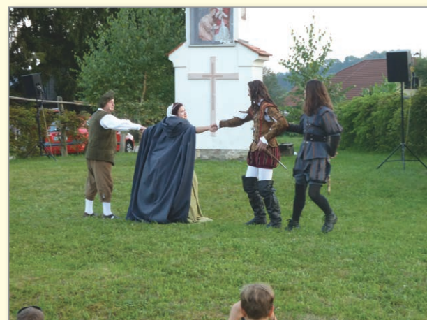
Težko slovo po poroki