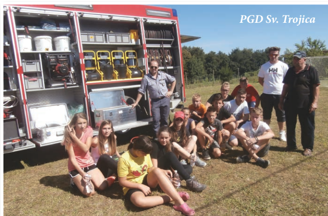
PGD Sv. Trojica