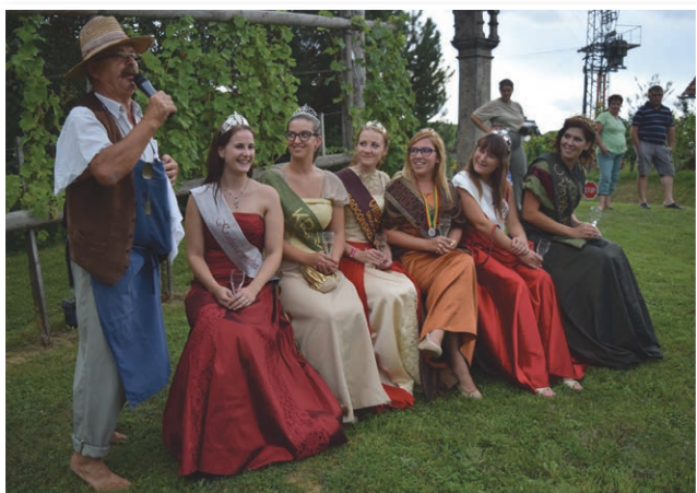
Ovtar ob vinskih kraljicah na postavitvi klopotca na Kapeli

Besedilo in fotografija: Filip Matko Ficko