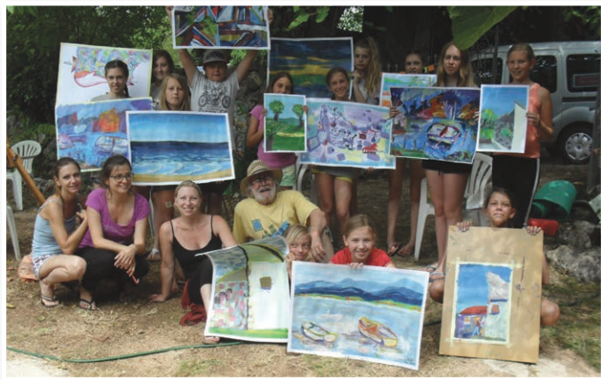
Mladi likovniki pri ustvarjanju z mentorji

Na Krku je nastalo 75 del v tehniki acryla in 27 študijskih risb v tehniki svinčnika, kar je največ doslej. Tudi tokrat je delavnica potekala na prostem, med oljčnimi nasadi, cipresami, žarečo kamnito morsko obalo z marinami in ribiški barkami, na katerih se veselo družijo galebi. Dela izhajajo iz barvnega realizma in so izraz podobe krajinskega izseka narave, pri čemer so skušali