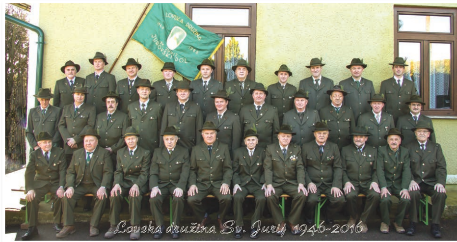
Lovci LD Sv. Jurij Jurovski Dol ob 70-letnici