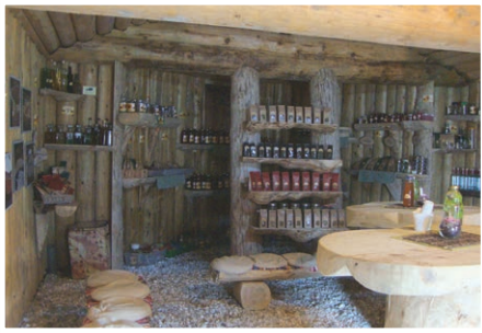
Zemljanka je lahko naša klet ali podaljšan vrt, saj koristimo energijo zemlje (poleti hladno, pozimi toplo).

Kot dober primer koriščenja naravnih danosti, ki jih nudi okolje, je koriščenje naravne mikroklimе v vkopanih (podzemnih) prostorih za shranjevanje (prezimovanje) pridelkov in tudi pridelavo pridelkov čez celo leto.