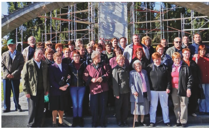
Z ene prejšnjih komemoracij v Gradcu