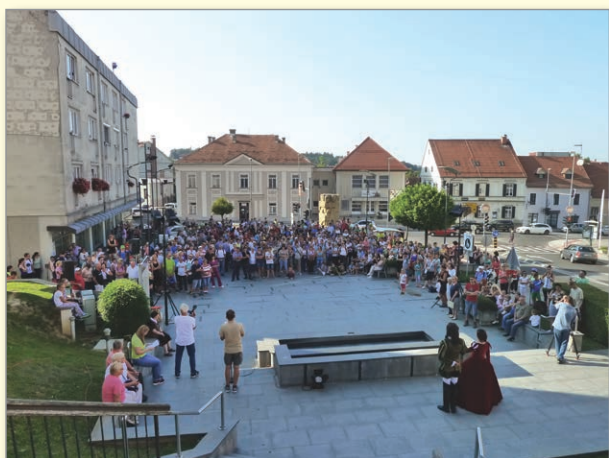
Začetek na osrednjem lenarškem trgu