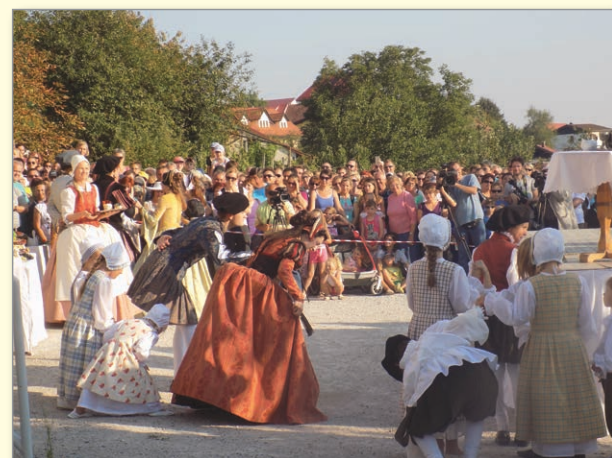
Ples na ploščadi pod cerkvijo