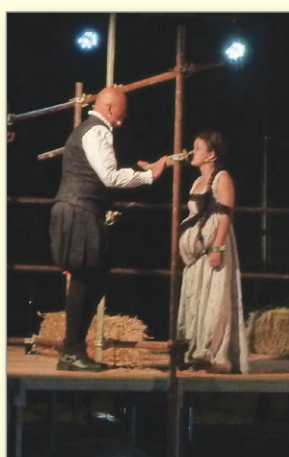
Agata v ječi, grofica se masti