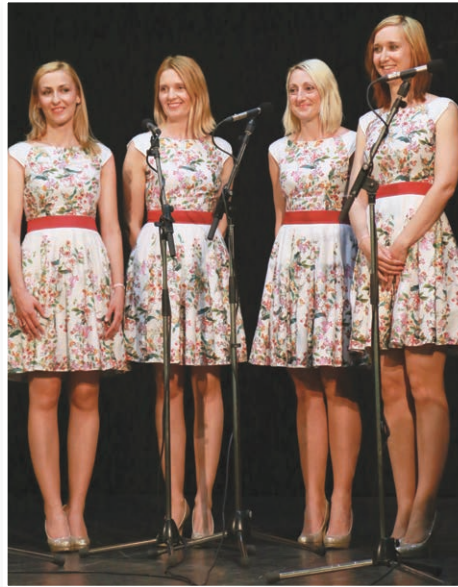
Vokalna skupina Vilineke iz Boštanj pri Krškem

V Jurovskem Dolu je v soboto, 18. 6. 2016, potekalo že V. srečanje oktetov in malih vokalnih skupin, ki ga v okviru Kulturnega