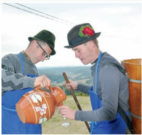
Trgatev na Pergerjevem vrhu