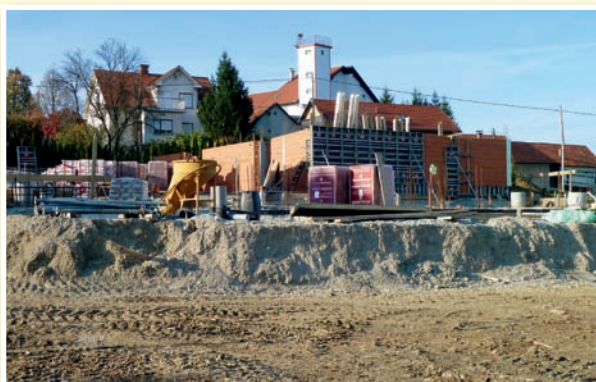
○ Cerkvjenjak: novi vrtec v dobiva prve obrise; so pred pomembnimi razvojnimi premiki.