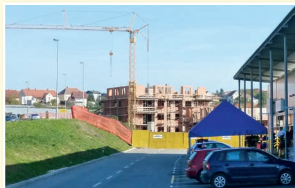
○ V Lenartu ob novem trgovskem središču gradijo nova nadstandardna stanovanja.