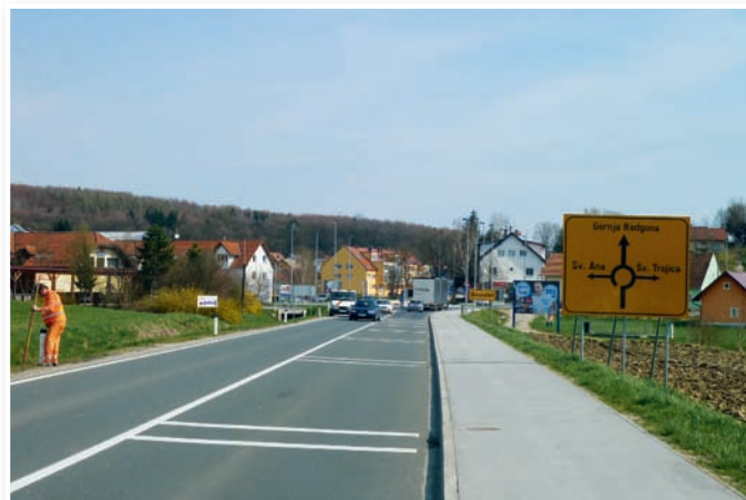
V Benediktu so se razmere na področju prometne varnosti spremenile tudi zaradi tega, ker je občina veliko pozornosti posvetila modernizaciji cest in preventivi v prometu.