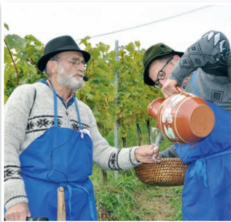
Ovtar in gospodar na trgatvi

šare, štirje putarji pa so natrgano grozdje prido nosili v viničarsko prešo, kjer se je stisnil prvi mošt, posvečen tej prireditvi. Za namen Postičeve poti je bilo možno kupiti tudi pose-