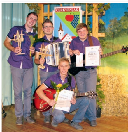
Štajerski fakini so se veselili dveh nagrad, druge nagrade strokovne komisije in nagrade občinstva.

Zmagovalci Livada, Štajerski fakini in Prleški odmev