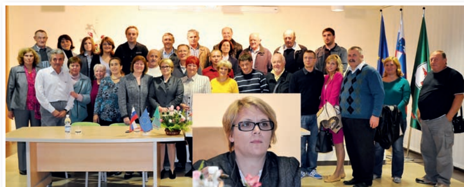
Ministrice za delo je obiskala Lenart v organizaciji Območne organizacije Socialnih demokratov Lenart.

ločen čas, kjer bo delodajalec moral delavca prijaviti že prvi dan zaposlitve, ne pa kot doslej, v osmih dneh. Veliko strožja bo zakonodaja tudi na področju delovnega prava in družinske zakonodaje, kjer bodo očetje lahko