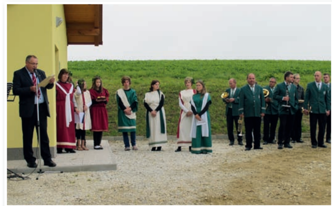
Na prireditvi »Po poteh starih Rimljanov« so kulturni program izvedli v oblačilih starih Rimljanov.