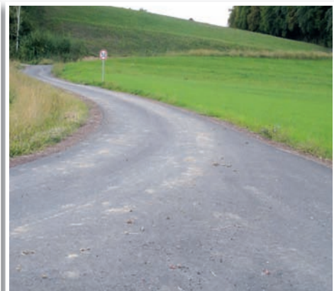
Dva modernizirana cestna odseka v Čagoni že služita svojemu namenu.