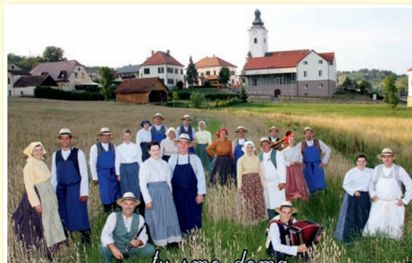
○ Jurovčani odpirajo obnovljen kulturni dom in praznujejo 40-letnico folklore.