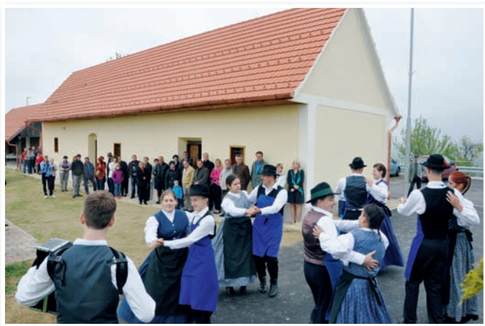
Ples folklore in obiskovalci v ozadju