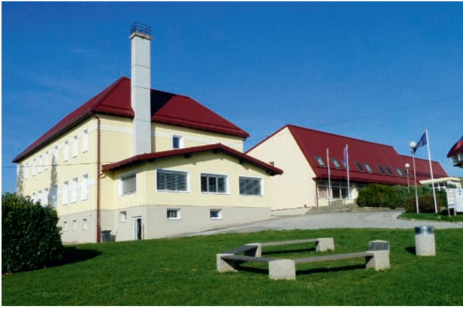
Tako je videti energetska obnovljena OŠ Lenart.

ška in instalacijska dela v višini 547.077,28 EUR, z upoštevanjem stroškov izdelave pro-