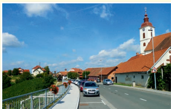
○ Turistična ponudba Sv. Ane izhaja iz tradicije in dediščine: turistične poti in razstave.