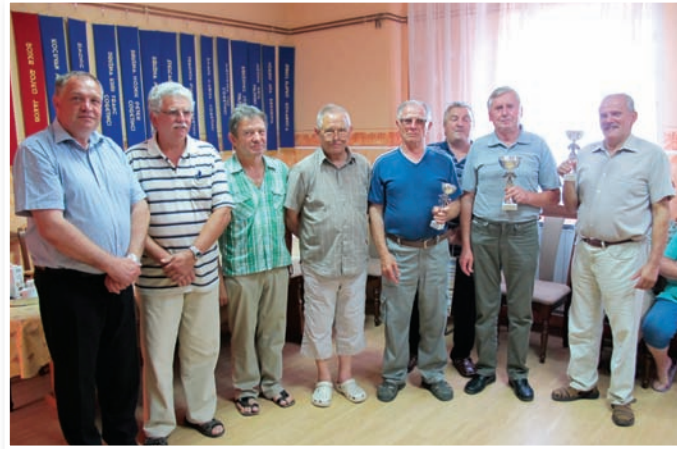
Utrinek s podelitve priznanj najboljšim šahistom med upokojenci

Društvo upokojencev v Cerkevniku je v okviru občinskega praznika občine Cerkevnik organiziralo meddruštveno tekmovanje v šahu v okviru Zveze društev upokojencev v Lenartu. Na šahovskem turnirju, ki so ga pripravili v prostorih društva upokojencev v Cerkevniku, se je zbralo 15 tekmoval-