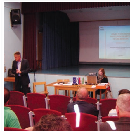
Javna obravnava dopolnjenega osnutka OPN občine Benedikt v Kulturnem domu Benedikt

Občina Benedikt je 17. junija zaključila javno razgrnitev dopolnjenega osnutka Občinskega prostorskega načrta (OPN) in okoljskega poročila k dopolnjenemu osnutku OPN. V času javne razgrnitve, 5. 6. 2013, je bila v Kulturnem domu Benedikt organizirana javna obravnava, ki se je udeležila tudi predstavica izdelovalca OPN, podjetja Urbis, d. o. o., iz Maribora. V razpravi je predstavica Urbisa predstavila postopek sprejemanja OPN ter njegovo vsebino. Čeprav postopek sprejemanja novega OPN-ja v občini Benedikt traja že od leta 2010, smo v občinski upravi pričakovali, da bo udeležba na javni obravnavi tako pomembnega dokumenta večja in da bo podanih več konstruktivnih pripomb in predlogov. Prispele pripombe in predloge bomo preučili ter do njih zavzeli javna stališča, ki bodo objavljena na spletni strani občine Benedikt. Seveda pa s tem postopek sprejetja OPN še ni zaključen, saj moramo sedanji predlog OPN ponovno posredovati vsem nosilcem urejanja prostora, da o njem podajo ustrezna mnenja. Po pridobitvi vseh pozitivnih mnenj mora OPN