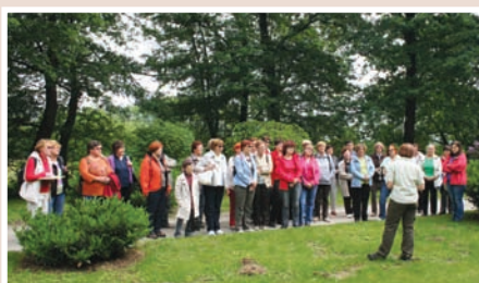
Botanični vrt Univerze v Mariboru