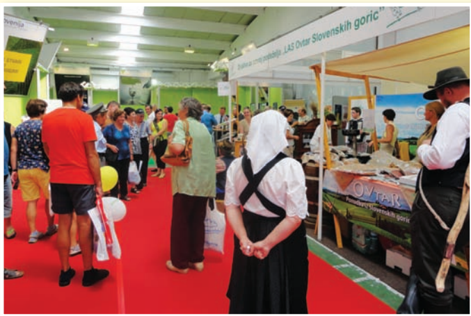
Lani je bilo veselo...

Vsi pristrčno vabljeni, da nas obiščete na našem razstavnem prostoru!