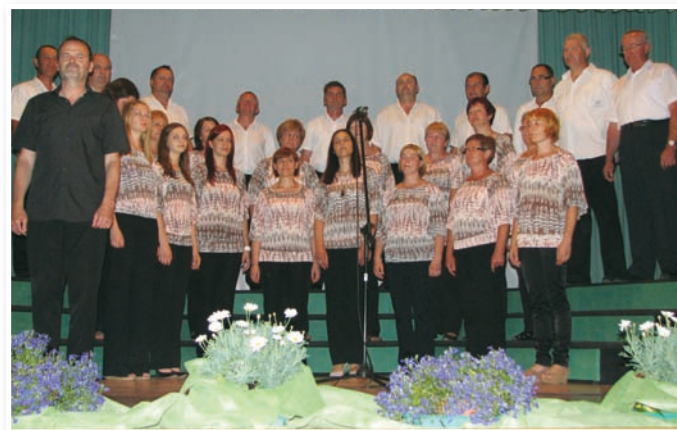
Mnogo obiskovalcev osrednje slovesnosti, nastop folklorne skupine in mešanega pevskega zbora, foto: Franc Bratkovič

Tako je Aero klub Sršen pripravil srečanje pilotov in ljubiteljev letenja, na katerem je z letali sodelovalo več kot 40 pilotov iz vse Slovenije. Osnovna šola je pripravila že 7. Otroško likovno kolonijo Maksa Kavčiča, Športno društvo Cerkvenjak pa je organiziralo rekreacijsko vožnjo s kolesi po mejah občine. Slovenskogoriški forum je letos pripravil zanimivo okroglo mizo na temo »Cerkvenjak in osrednje Slovenske gorice včeraj, danes, jutri – tradicija in perspektiva«, člani Društva generala Maistra pa so pripravili pohod po severni meji občine. Nogometni klub je pripravil pravi nogometni turnir vseh selekcij od U-8 do članov, izkazali pa so se tudi člani kulturnega društva, ki so sodelovali na mnogih prireditvah. Na več prireditvah so sodelovali tudi člani Društva vinogradnikov in ljubiteljev vina Cerkve-