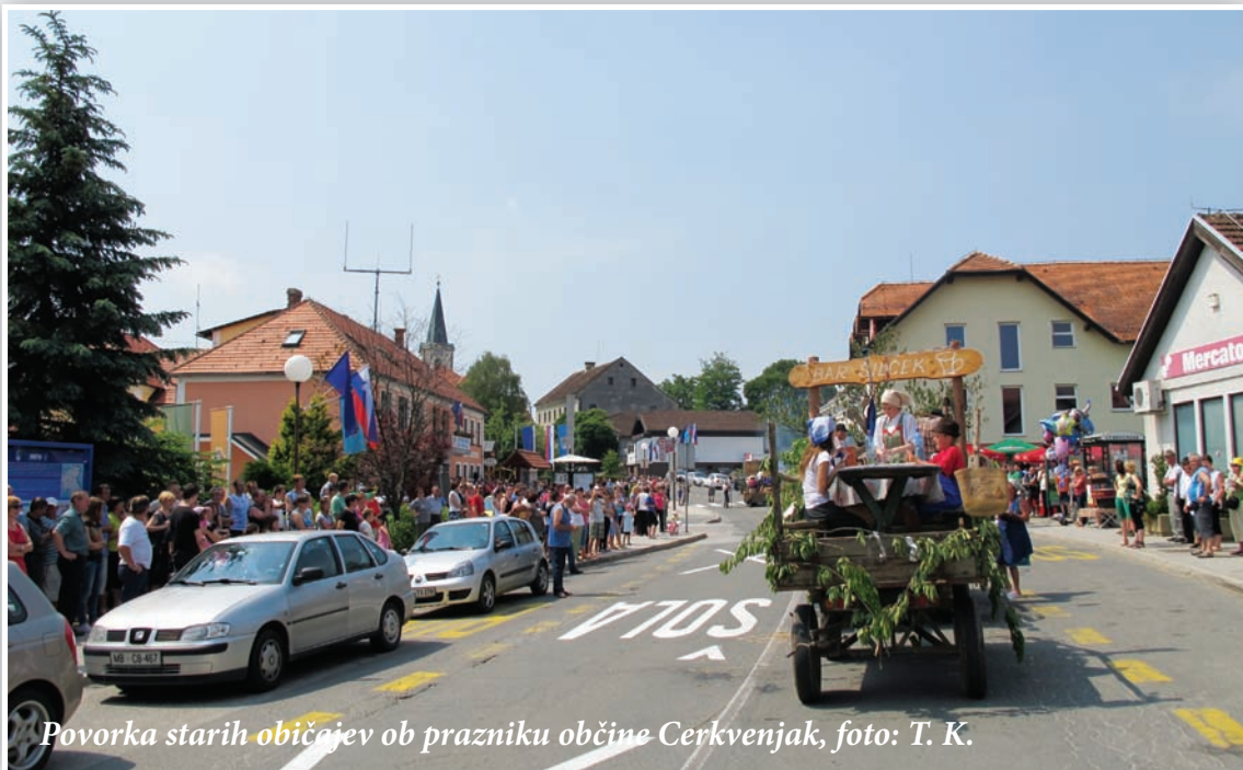
Povorka starih običajev ob prazniku občine Cerkljenjak