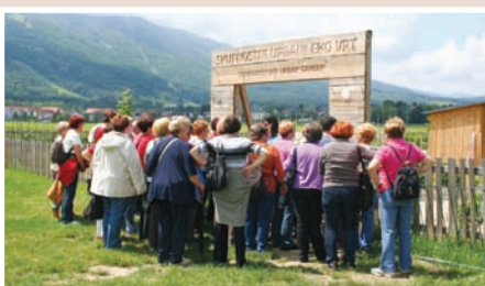
Skupnostni urbani eko vrt