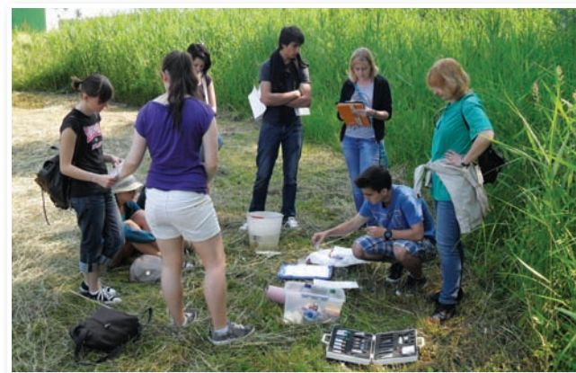
Meritve abiotičnih dejavnikov, delo kemikov