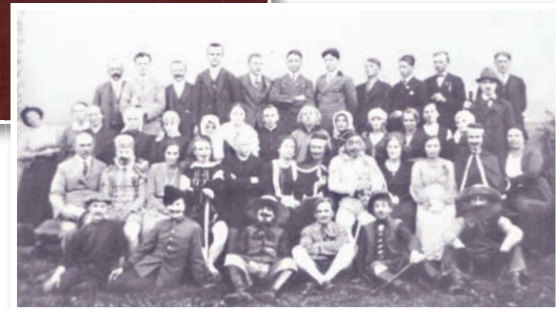
Igralska zasedba iz leta 1932