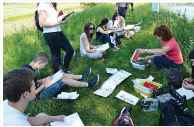
Raziskovanje rastlin, botanična skupina