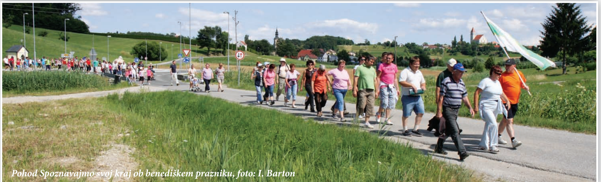
Pohod Spoznavajmo svoj kraj ob benediškem prazniku, foto: I. Barton