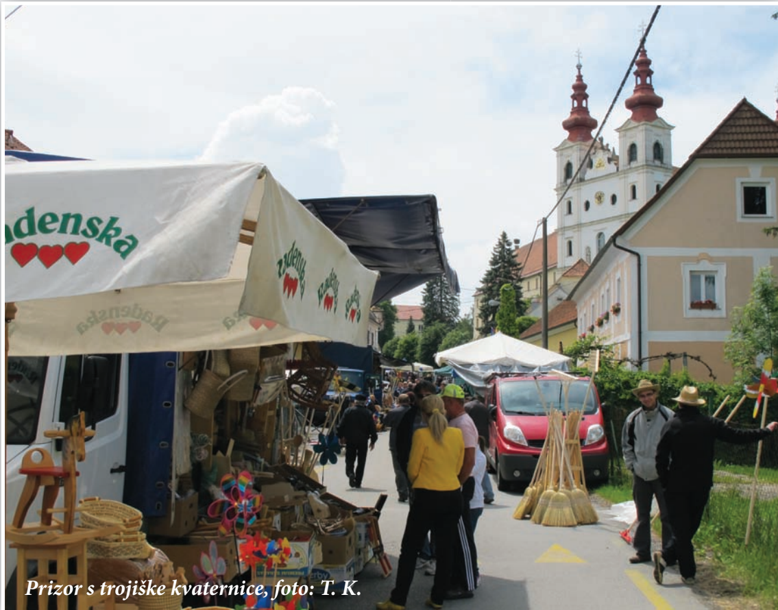
Prizor s trojiške kvaternice