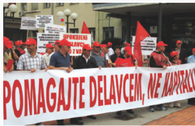
Presojo ustavnega sodišča o odpisu oziroma odlogu plačevanja prispevkov je zahtevala Zveza svobodnih sindikatov Slovenije

odpis, odlog ali obročno odplačevanje prispevkov za zavarovanje v nasprotju z določbami slovenske ustave in da pomeni nedopusten poseg v pravico delavca. Odločitev ustavnega sodišča pomeni velik korak naprej v priznavanju pomena in vloge prispevkov v si-