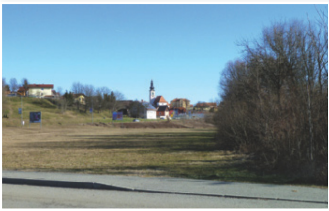
Čakajoča investicija ob lenarški vpadnici