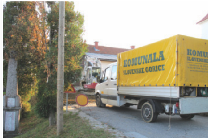
Kljub krizi imajo delavci podjetja Komunala Slovenske gorice še polne roke dela, kar kaže na to, da dela opravijo kakovostno

oskrba SV Slovenije s pitno vodo, vodovod v Lovrencu na Pohorju, Čistilno napravo v Cerkevniku, Športno-rekreacijski center Cerkevjak, kanalizacijo v Gornji Radgoni, vodovod in čistilno napravo v Sveti Ani in še celo vrsto drugih komunalnih objektov, poleg tega pa so izvajali tudi rekonstrukcijo cest. Nekateri večje projekte so lani že končali, z nekaterimi pa nadaljujejo v tem letu.