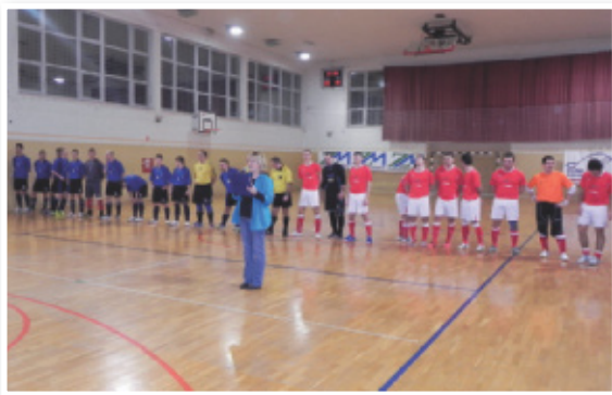
Tudi tokratni derbi med Slovenskimi goricami in Benediktom postregel z zanimivim obračunom, številnimi zadetki in kartoni