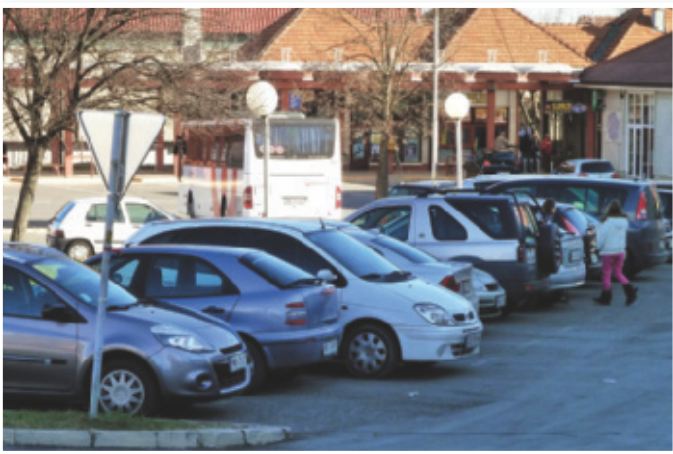
Lenarška parkirišča so v glavnem polna, redarji nadzorujejo parkiranje na nedovoljenih mestih

Oba skupna občinska organa so ustanovile iste občine ustanoviteljice, zato njune službe delujejo na istem teritorialnem območju. Zato se je porodila ideja, da bi obe službi združili in s tem zmanjšali stroške za njuno delovanje.