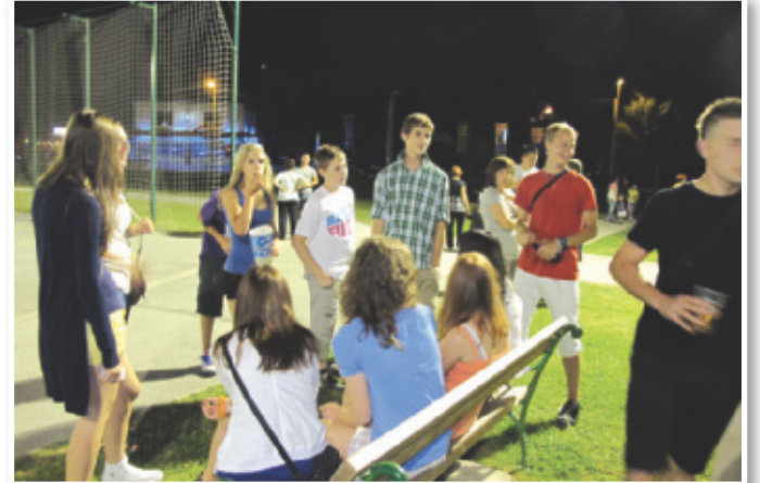
Občina Benedikt, v kateri je veliko otrok in mladine, vzorno skrbi za razvoj športa

Športne prireditve bo občina sofinancirala s