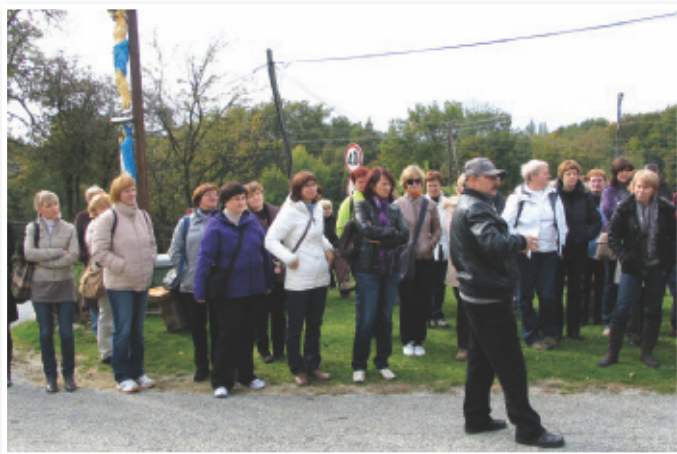
Turisti iz Dolenjske

Turistično društvo Sv. Ana je več kot uspešno zaključilo lansko leto, saj je kraj z enodnevnim izletom spoznavalo 60 avtobusov turistov iz vseh koncev Slovenije. Ob vsem tem so poizkusili odlične domače dobrote ter vrhunska vina domačih vinogradnikov. Da pa se v društvu trudijo, pove podatek, da razmišljajo o turizmu z namestitvenimi kapacitetami.