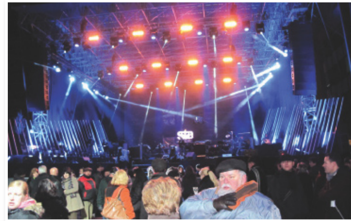
Maribor je postal »Evropska prestolnica kulture 2012« z veličastno otvoritveno prireditvijo na Trgu Leona Štuklja v središču mesta