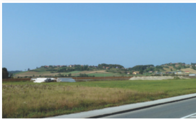
Nova poslovno industrijska cona

»Proračun za leto 2012 je težak 19 milijonov evrov. Od tega seveda moramo odšteti investicije, ki so povezane z izgradnjo vodovodnega sistema v okviru celovite oskrbe SV Slovenije s pitno vodo za skupino občin. Ker je občina Lenart koordinatorica projekta, gre celoten finančni del preko lenarškega občinskega proračuna. Njegova vrednost je okrog 9,5 milijona evrov. Ta znesek moramo odšteti od samo lenarškega proračuna. Proračun občine Lenart za leto 2012 je tako težak nekaj manj kot 10 milijonov evrov.«