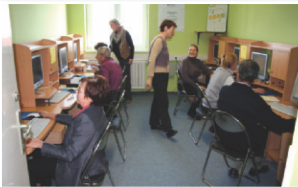
Dobimo se v računalnici

»Ker mi je računalnik predstavljal tabu, sem se odločil za začetno učenje računalništva, da si pridobim osnovna znanja za uporabo. S tečajem sem zelo zadovoljen, saj kljub svojim 73 letom tekoče spremljam snov.«