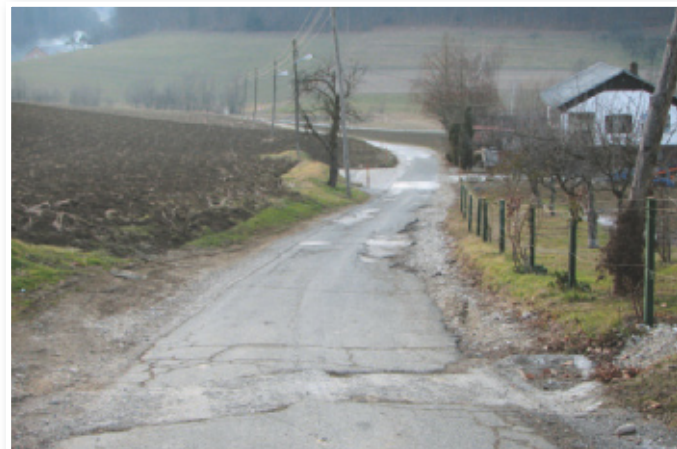
Novo asfaltno prevleko bo v letošnjem letu dobil Lešnikov klanec, katerega cestišče je že zelo načeto

Poleg že omenjenih projektov in rednih mesečnih transferjev (šolstvo, sociala, zdravstvo ...), ki jih je občina po zakonu dolžna izvajati in plačevati, bodo manjša popravila oz. obnove opravljene tudi v mrliški vežici. Novo podoba pa bo Jurovski Dol kazal tudi ob vstopu v sam center, saj bodo uredili tudi obzidja pri starem pokopališču.