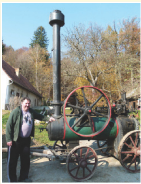
Lokomila Hofherr Schrantz iz leta 1922

V Benediktu sta 27. 12. 2011 v okviru projekta Kmetijska tehniška dediščina, ki ga je izvajal Klub Starodobnik Slovenske gorice, izšla Elaborat o pripravi muzejske zbirke starih traktorjev in druge kmetijske tehniške dediščine v osrednjih Slovenskih goricah ter publikacija Tehniška dediščina (katalog izbranih starih traktorjev in druge kmetijske tehniške dediščine v osrednjih Slovenskih goricah) v tiskani in elektronski obliki. Informativni in vzgojni namen projekta je tudi predstavljen na dveh panojih, ki sta razstavljena v Avli Jožeta Hudalesa v Lenartu.