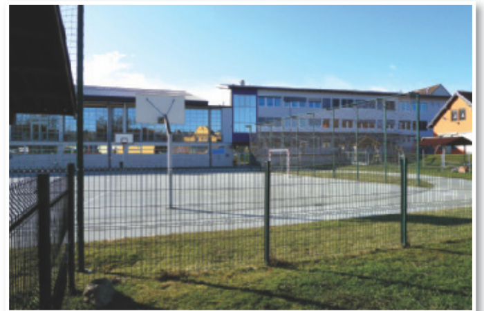
Zunanji športni prostori in športna dvorana v središču Benedikta

Skupno bo občina za sofinanciranje športa po letnem programu športa namenila 38.000