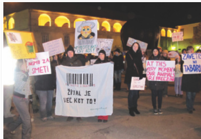
Medtem ko je na Trgu Leona Štuklja potekala otvoritvena slovesnost, so na Trgu svobode potekale demonstracije, na katerih so vzklikali: »Maribor, prestolnica korupcije.«