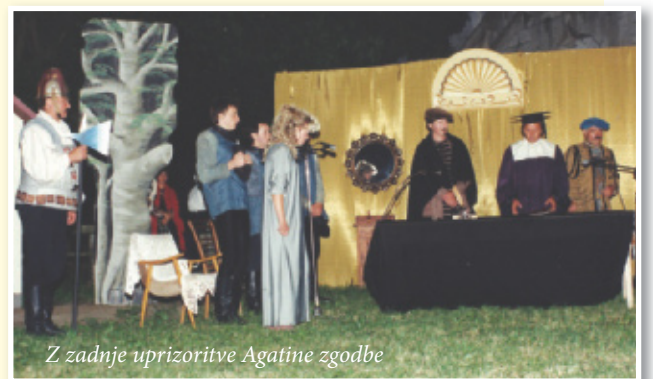
Z zadnje uprizoritve Agatine zgodbe

Projekt bo eden največjih v zgodovini igralskega Slovenskih goric, zato moramo stopiti skupaj odgovorni, prilagodljivi in vztrajni ljudje, kulturniki z dušo na pravem mestu!