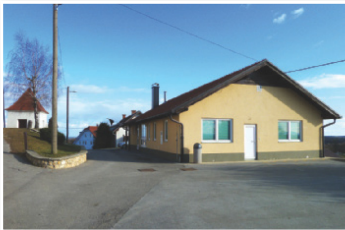
Obnovljena ambulanta v Cerkevjenjaku čaka na prihod zdravnika