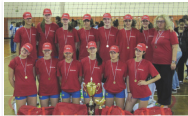
Prvo mesto je pripadlo igralkam srbskega kluba Poštar 064