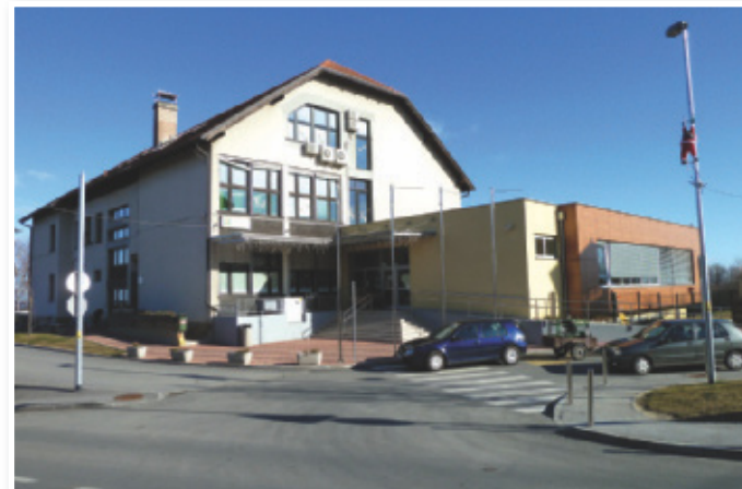
Ekošola in vrtec spodbujata projekte za varovanje okolja in zdravo hrano, foto: E. P.

Razveseljiv je tudi podatek, da je športna dvorana zelo zasedena, kljub podaljšanemu urniku obratovanja s 45 na 60 minut. »V tem lahko vidimo upravičenost objekta in namen-