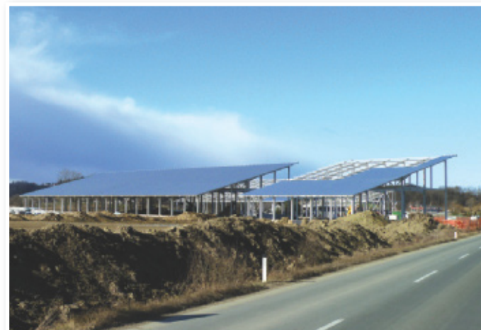
Elektrika iz sončne elektrarne je vse bližja

Zemljišče, ki je namenjeno industrijski coni, kjer se trenutno odvija intenzivna gradnja sončne elektrarne, je v treh četrtinah že prodano, pred kratkim je bila prodana parcela v izmeri 5000 m 2 , ker pa pogodbe še niso podpisane, bomo o novem investitorju brali v naslednji številki. Nekaj manjših parcel je še na razpo-