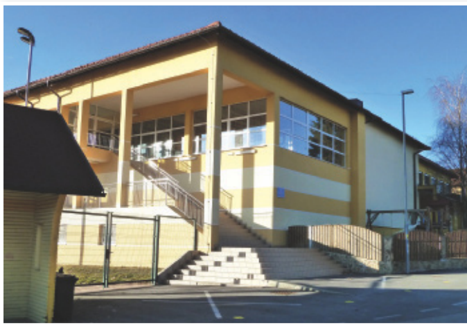
Šola z vrtcem

V občini Sveta Trojica so leta 2010 za ogrevanje in pridobivanje toplotne energije v individualnih hišah in večstanovanjskih objektih potrošili okoli 347 tisoč litrov kurilnega olja, okoli 19.500 litrov utekočinjenega naftnega plina, 17 ton premoga in skoraj 1.100 kubičnih metrov drv.