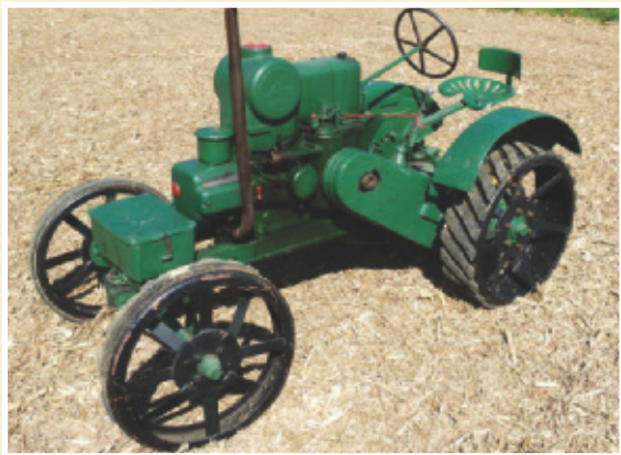
Eden najstarejših traktorjev Svoboda iz leta 1937

Partnerja LAS-ovega projekta sta občina Benedikt ter Zgodovinsko društvo Slovenske gorice.