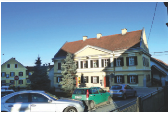
Ogrevanje javnih in zasebnih objektov terja veliko energije

Največji delež toplotne energije, kar 95 odstotkov, porabijo v stanovanjskih objektih. Večja podjetja predstavljajo en odstotek porabe energije, javni objekti pa 4 odstotke. Za ogrevanje v največji meri uporabljajo kurilno olje (49 odstotkov), sledijo pa mu biomasa – v glavnem drva (44 odstotkov), utekočinjen naftni plin in električna energija.