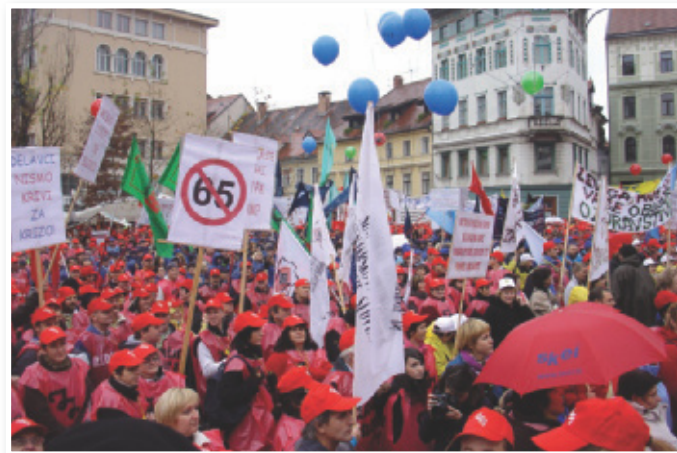
Tako so pred leti delavci iz vse Slovenije na Prešernovem trgu v Ljubljani demonstrirali za dvig minimalne plače

davčna zakonodaja, saj se delavcem pri določeni bruto plači z dvigom bruto plače zmanjša neto plača. Tako denimo pri povečanju bruto plače iz 860 evrov na 870 evrov delavec izgubi kar 20 evrov neto plače na račun splošne olajšave, ki se mu zniža za 167 evrov. Šele pri bruto plači v višini 910 evrov se izniči vpliv znižane splošne olajšave. Enako se zgodi zaposlenim, ki se jim bruto plača poveča iz 997 evrov na