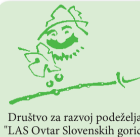
Društvo za razvoj podeželja "LAS Ovtar Slovenskih goric"