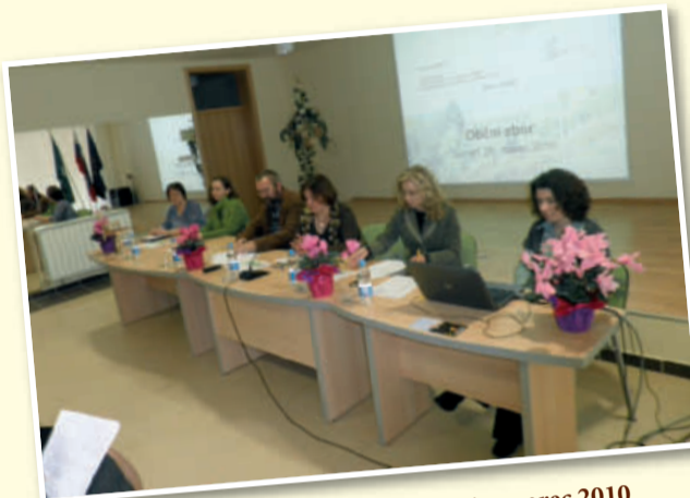
Občni zbor LAS Ovtar Slovenskih goric, marec 2010