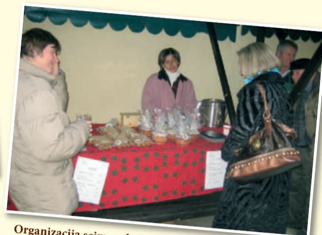
Organizacija sejmov: božični in predvelikonočni