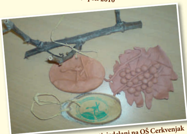
Spominki Klopotčeve učne poti, izdelani na OŠ Cerkvenjak - Vitomarci