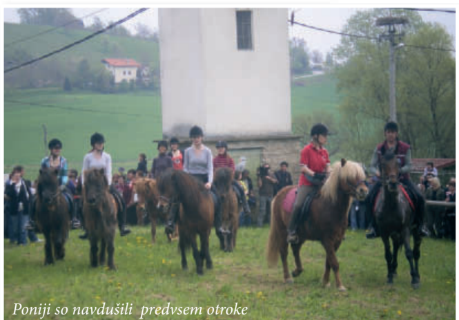
Poniji so navdušili predvsem otroke