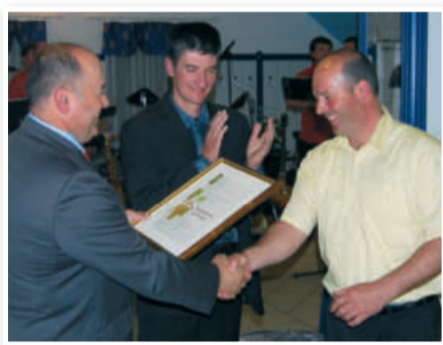
Županovo vino 2010 je rumeni muškata vinogradništva Kramberger