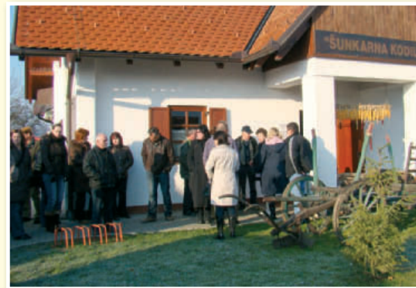
Strokovni posvet in ekskurzija za potrebe uveljavljanja blagovne znamke Ovtar, december 2009