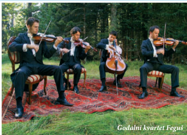
Godalni kvartet Feguš

Sobota, 4. september , ob 20. uri GLISANDO, koncert