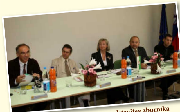
Arhitekturna delavnica Lenart, predstavitev zbornika