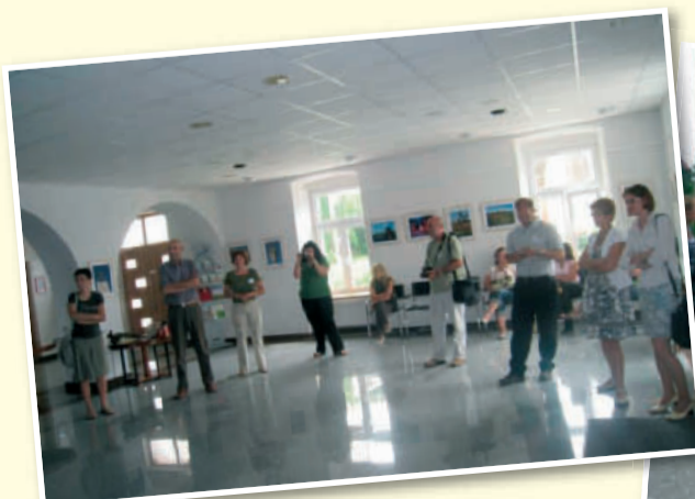
Srečanje LAS-ov Slovenije