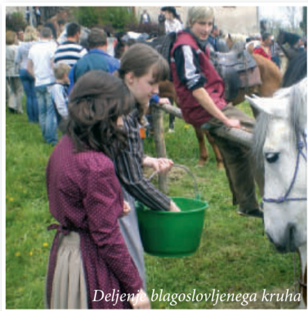
Deljenje blagoslovljenega kruha

V okviru občinskega praznika občine Sv. Jurij več let zapovrstjo poteka tudi tradicionalni blagoslov konjev, na katerih jezdec prihajajo od blizu in daleč. Po opravljenem bogoslužju v farni cerkvi Sv. Jurija, ki se ga je udeležilo veliko število domačinov in romarjev iz drugih krajev, je bil tradicionalni blagoslov konjev. Da so konji res nekaj posebnega, je dokazala nepregledna množica radovednežev, ki se je zbrala ob prireditvenem prostoru v neposredni bližini farne cerkve. Blagoslova se je udeležilo več kot sto konjenikov, ki so dodobra popestrili farno »žeganje«.