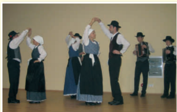
Nastop folklorne skupine na božično-novoletnem sejmu, december 2009