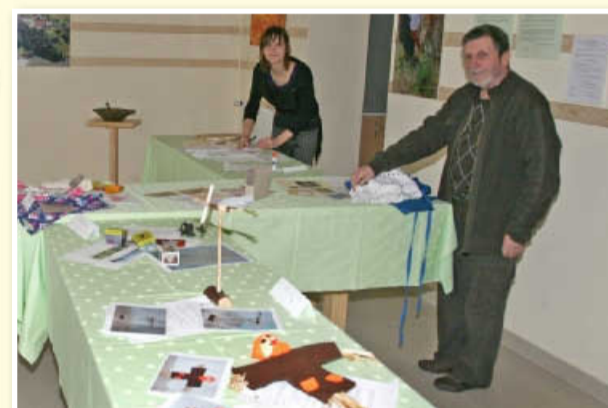
Priložnostna razstava vseh sodelujočih predlogov za spominek osrednjih Slovenskih goric