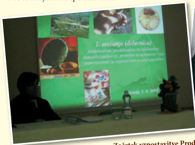
Začetek vzpostavitve Prodajnih poti podeželja, 2009

Fotogalerija nekaterih projektov iz Letnega izvedbenega načrta - LIN za 2008 in 2009, ki so se zaključili do spomladi 2010.