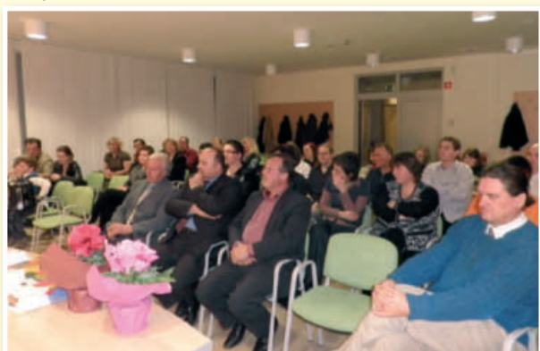
Svečana podelitev potrdil lokalnim turističnim vodnikom za območje Štajerske