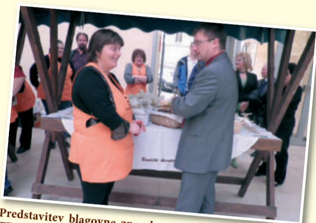
Predstavitve blagovne znamke »Benediški klecprot«, TD Klapovuh iz Benedikta, april 2010