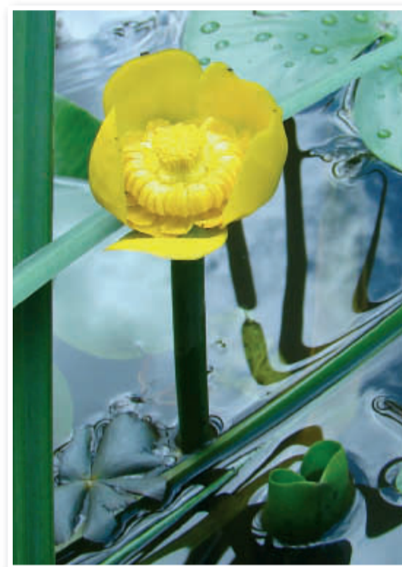
Za dobre fotografije je potrebna potrpežljivost in tudi kanček sreče

Trenutno mi fotografija veliko pomeni. Svoj prostor sem si poiskal v naravi. Želim si dokumentirati neko obdobje Slovenskih goric, in to predvsem tistega, ki ga niti ne opazimo. In to na majhnem prostoru, kot je Komarnik. Fotografij se je nabralo veliko, največ pa mi pomenijo tiste, ki so nastale spontano, ko me je trenutek v naravi prisilil v uporabo fotoaparata: to je lahko nenavadna svetloba, mehkoča, odsev v vodi, oblak, vkomponiran v let ptice, ... Dobesedno ob pravem času na pravem mestu.