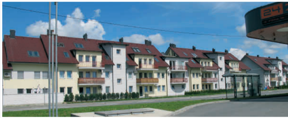
Središče Benedikta že dolgo ne daje več podeželskega videza

Z investicijo v Terme Benedikt se razvoj v tem delu osrednjih Slovenskih goric ne bo ustavil, temveč bo dobil nov zagon. »Prioritete našega razvoja že od sredine devetdesetih let vidim v razvoju turizma in v razvoju podeželja. Vsak kraj ne more imeti industrijske cone. Danes se ljudje brez težav vozijo na delo v industrijska središča