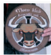
Znak društva »Moto klub Ruperški voli«