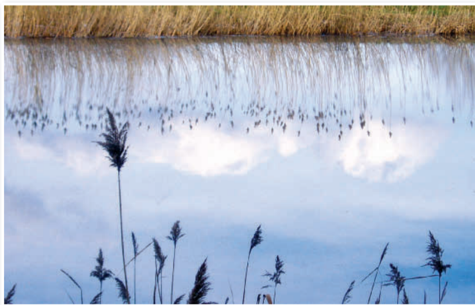
Jezero Komarnik, ki ga človeški posegi čedalje bolj ogrožajo

Pustila mi je mešane občutke. Več je pozitivnih. Ljudje so videli, da lahko za naravo nekaj storijo. Odziv je bil pričakovano velik in verjetno dal misliti, kako v bodoče. Tem ljudem ni bilo mar, da čistijo za drugimi. Bili so zadovoljni, da so naredili nekaj več. Seveda pa so se našli tudi taki, ki so potihoma rekli tej akciji Očistimo svoje dvorišče v enem dnevu. Pa tudi to je navsezadnje nekaj. Bolje, kot da ta navlaka konča v vodi ali ob gozdu.