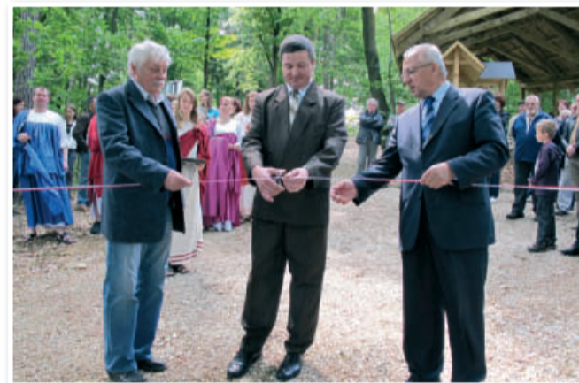
Otvoritev arheološkega parka

gozda so uredili zelo veliko parkirišče, na katerem se bodo lahko ustavljali tudi avtobusi in podobno.