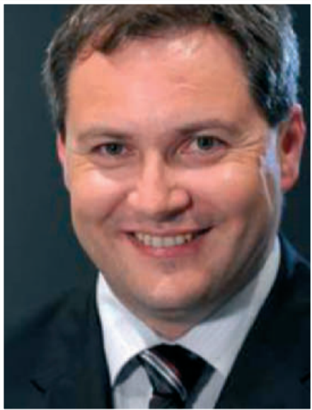
Kmetijski minister Dejan Židan

P rvi majski petek zjutraj je na Ministrstvu za kmetijstvo, gozdarstvo in prehrano RS prevzel posle novi minister mag. Dejan Židan. Odločujoče je prepričal s svojo strokovnostjo in vizijo, njegov ne-strankarski status pa je prestregel marsikatero politično poleno. Prvo jutro po imenovanju v DZ sem ga po telefonu, bil je na poti iz Murske Sobotne v Ljubljano, uspel pritegniti za pogovor za Ovtarjeve novice.