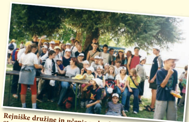
Rejniške družine in učenje za kvalitetno starševstvo v Slovenskih goricah, rejniški piknik