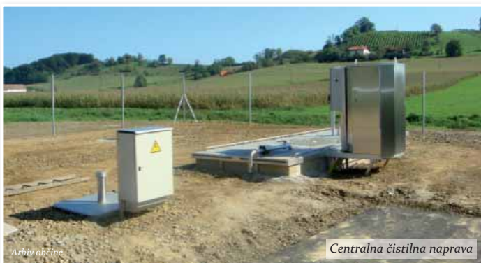
Centralna čistilna naprava

Seveda je najpomembnejša skrajšana pot do avtoceste, do Maribora in potem naprej.