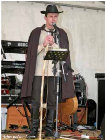
Sedanji ovtar Slovenskih goric v svoji opravi

Ker se grozdje že precej časa pred trgatvijo »mehča«, nekako od srede avgusta dalje in je lahek plen za ptiče in razne nepridiprave, postavimo v Slovenskih goricah v vinograde klopotece.