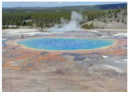
Grand prismatic geyzir

Ali kdo verjame, da je povprečen prebivalec severnoameriške celine kdaj slišal za Slovenijo? Seveda je, saj se je 20 let nazaj odcepila od Češke, zdaj pa je soseda Rusije, občasno pa za hobi napade tudi kako sosedo. No, ko pa že stotič začneš risati geografsko okolico te naše 'kure', pa se jim začne blede svitati, da so res preveč 'špicali' geografijo v šoli ... In ko dodaš še, da