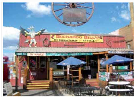
Gostilna west style

Seveda povsod ni tako. Ko se popotnik odpravi na nekoč 'divji zahod', kjer dandanes kraljuje moderna mesta na eni strani ter prostrana narava na drugi, pravzaprav dobi občutek, kako ogromna država je to. Zato tudi ne čudi, da imajo Američani nekaj navad, ki jih sodoben Evropejec nikoli ne bo razumel in ki se jih včasih niti ne da razložiti. Na primer, zakaj si vsi Američani ogromne kozarce z že tako ledeno hladno pijačo še dodatno do vrha natrpajo z ledom? Tega nihče ne ve, niti oni sami si tega ne znajo razložiti. In zakaj jih skoraj zadene kap od začudenja, ko si nekdo še doda kečap na pijo? Zato, ker tega še nikdar niso poskusili sami, ko pa naredijo prvi grizljaj, se jim zdi, da je bila Amerika odkrita na novo. Zanimivo, a resnično.