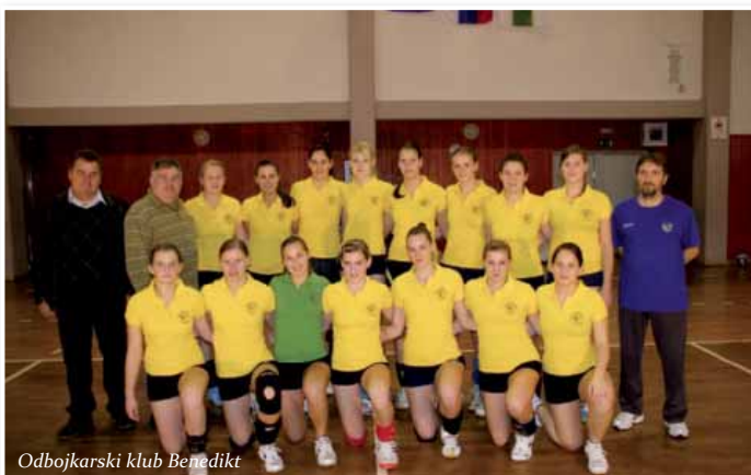
Odbojarski klub Benedikt