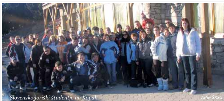
Slovenskogoriški študentje na Kopah

Prav tako vsako leto pripravijo športni vikend v Voličini, kjer potekajo turnirji v različnih športnih disciplinah (odbojka na mivki, tenis, mali nogomet, ...). Prav tako je tudi tek