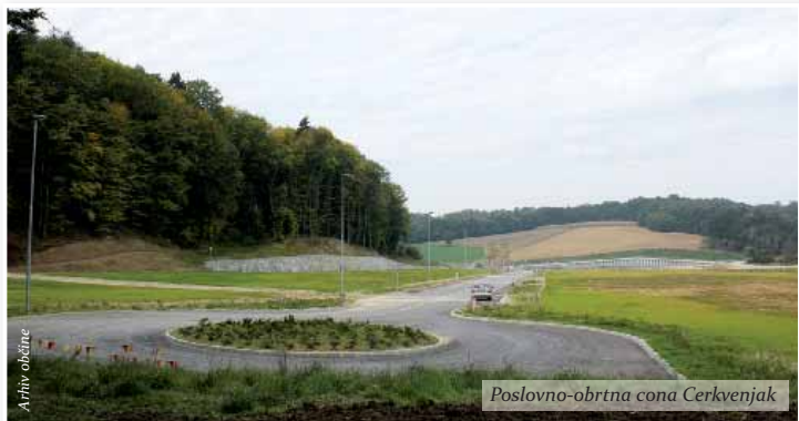
Poslovno-obrtna cona Cerkvenjak

V občini Cerkvenjak je kar nekaj objektov, ki so zgrajeni oz. sofinancirani tudi z drugimi viri nepovratnih sredstev resornih ministrstev. Vodovodi, kanalizacija, ceste, kulturna dvorana, rekonstrukcija zdravstvenega doma in investicija, ki je v teku, arheološki park rimskih gomilnih gribošč v Brengovi. Ocena višine nepovratnih sofinancerskih sredstev pa presega 400.000 evrov.