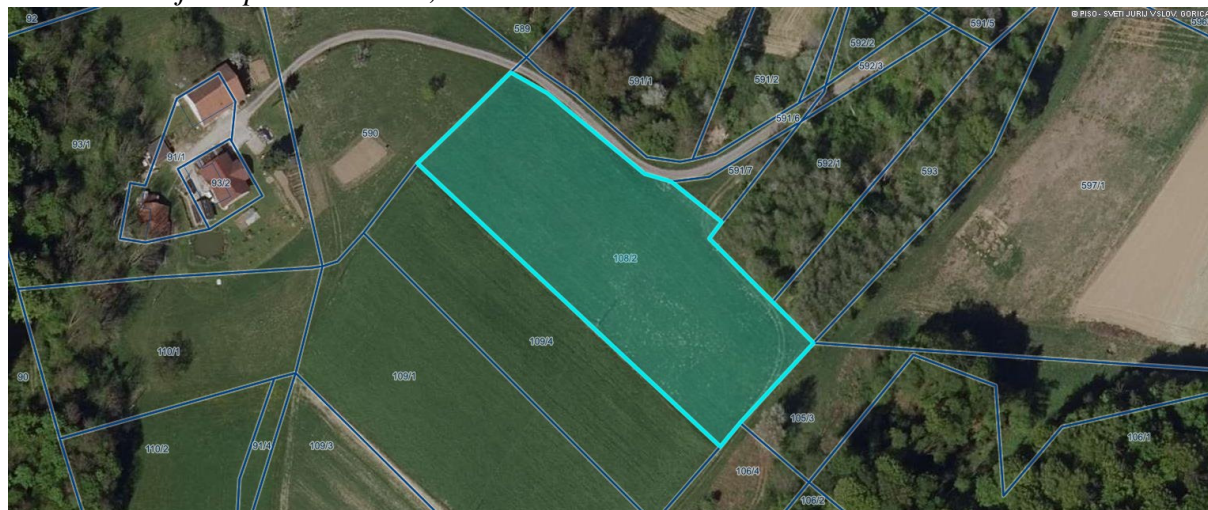
Slika 1: Zemljišče parc. št. 108/2, k.o. Jurovski Dol.

V načrt pridobivanja nepremičnega premoženja občine vključujemo zemljišče parc. št. 108/2, k.o. Jurovski Dol, ki predstavlja kmetijsko zemljišče. Občina Sv. Jurij v Slov. goricah že nekaj let ureja lastništvo Športnega parka Jurovski Dol, in sicer z zamenjavo kmetijskega zemljišča, ki je v solasti občine, kjer pa zaradi zavarovane terjatve s hipoteko na solastnem deležu solastnice, ne moremo dokončno urediti lastniških razmerij. V načrt pridobivanja predlagamo vključitev zemljišča, ki je sosednjo zemljišče in bi morebiti ravno zaradi lege lahko služilo za predvideno zamenjavo.